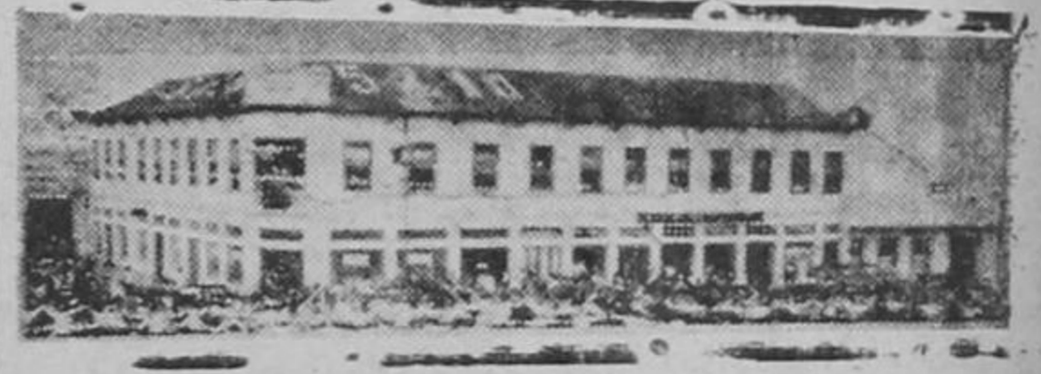
El viejo edificio "Tienda Cinco y Diez" que anoche quedó reducido a cenizas. Esta fotografía fué tomada por nuestro repórter gráfico Néstor Castillo hace algunos años cuando el edificio fué inaugurado