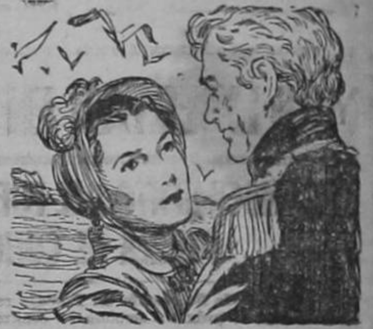
—¡No me olvides!—suplicó ella.

CUANDO HUBO visto a William y a su hermana Margarita besándose ante el arco floral de La Moma, Mariana Le Patourel se dió cuenta de que ella no podría por más tiempo engañarse a sí misma. Hubiera sido evidente al más tonto q' el amor de aquellos dos era el auténtico amor mutuo entre un hombre y una mujer que fué lanzado al mundo como el germen de su vida; y Mariana, no era tonta.