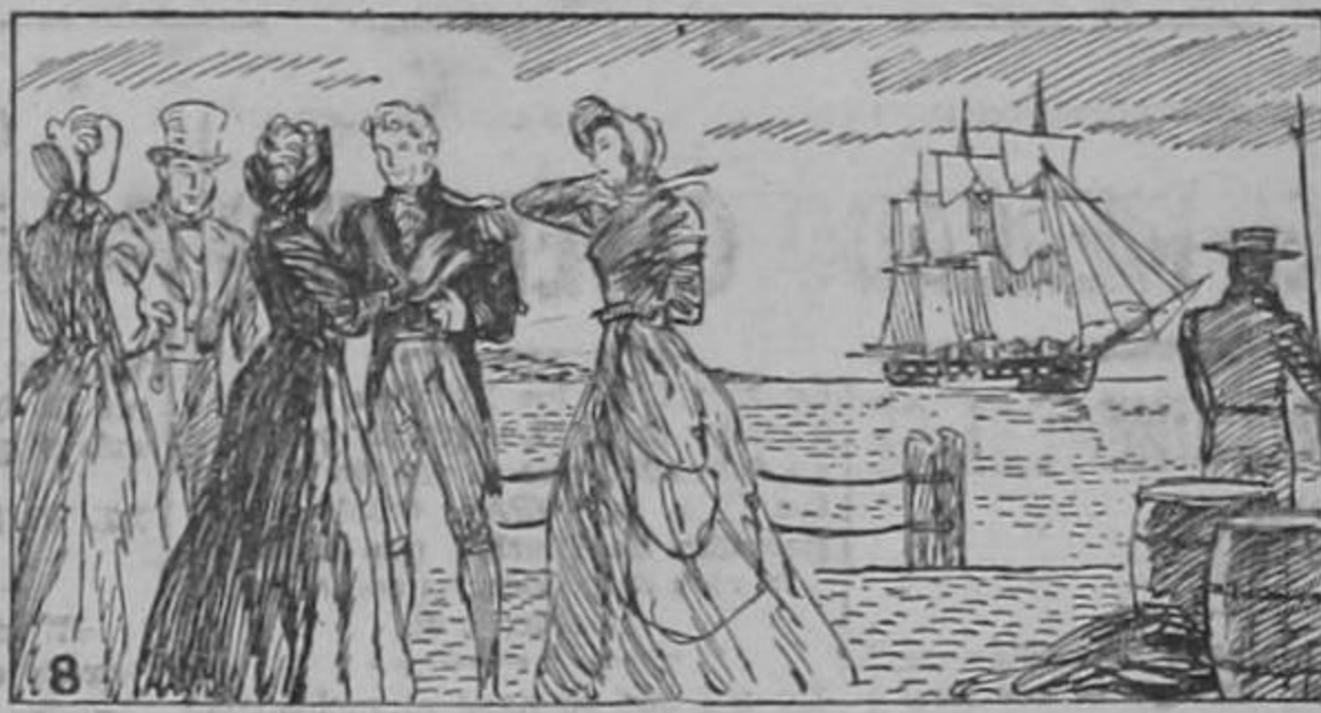
Ella se apartó mientras los otros se despedían de William.