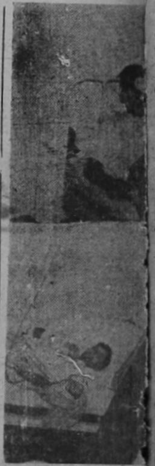
Las dos gráficas tomadas durante el movimiento de 'debelado'. Arriba, el policía de la sección de vigilancia especial fue agredido por los revolucionarios que se congregaron cerca de la casa de los centros de concentración. Abajo, un herido de los alzados, que resultó herido durante la presencia de los enfermeros del ejército nacional.