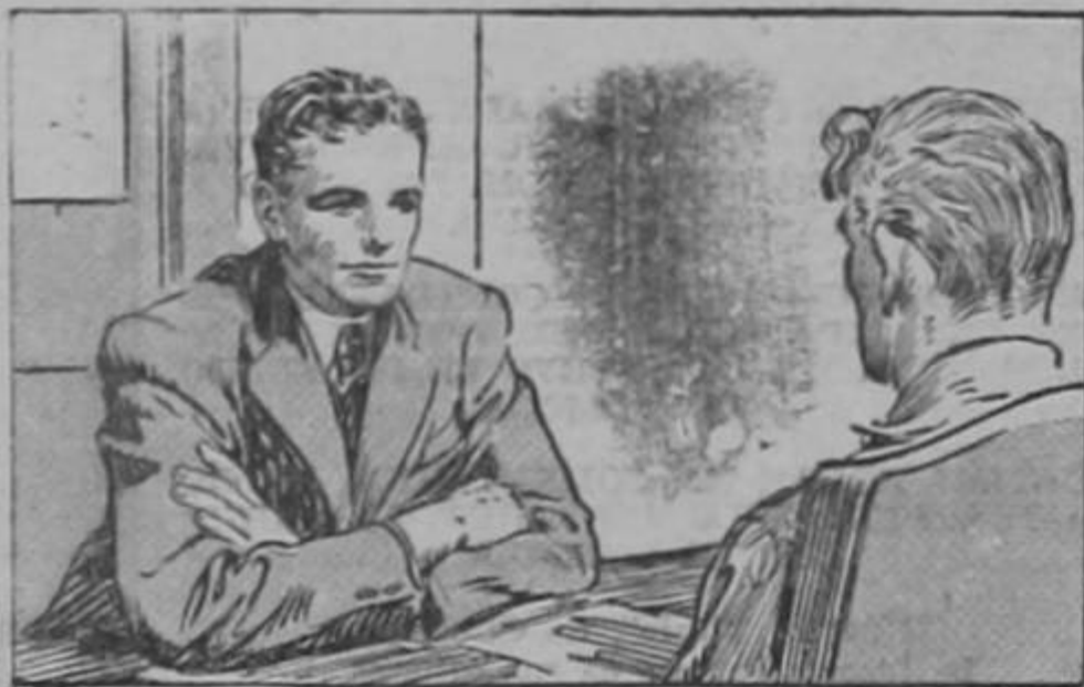
Keating dijo, — por qué no abandonas los ideales?