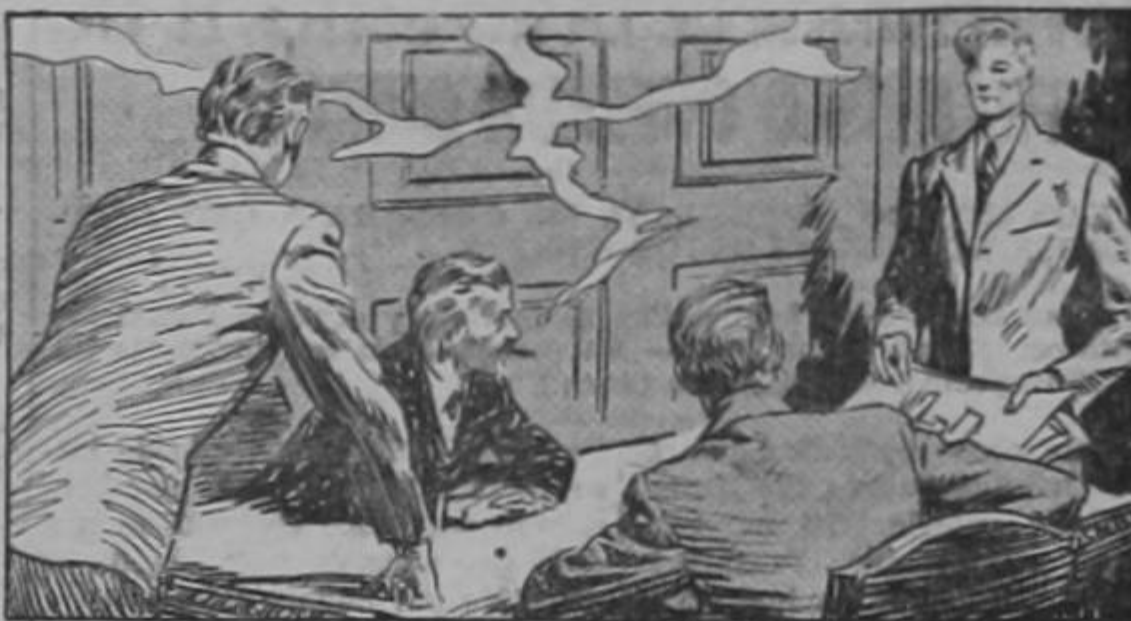
Le dijo a Roark: —Se dá cuenta de lo que hace?