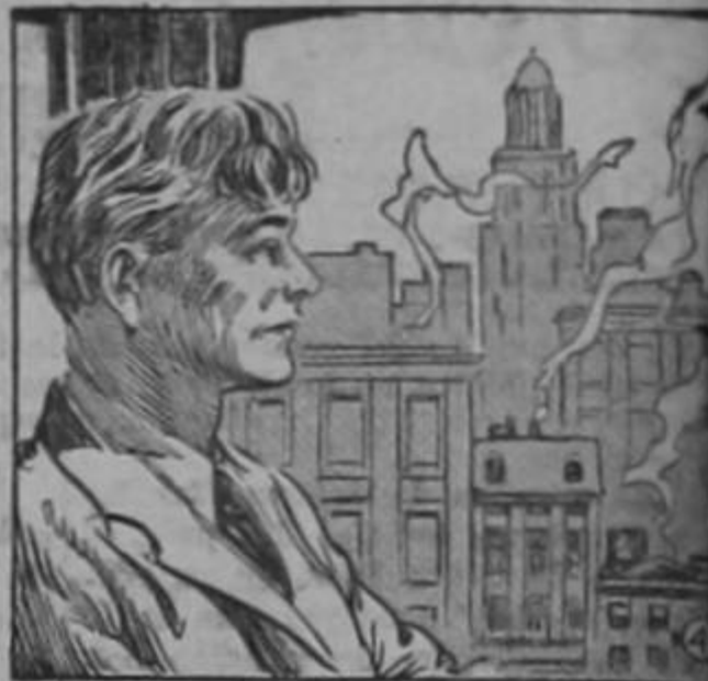
Roark contempló los rascacielos

Se le ofreció una última oportunidad a Roark. Presentó proyectos para un nuevo edificio de un banco. Es pero impaciente la decisión de la junta Directiva del banco, pero la misma se aplazaba de semana en semana; había quienes se oponían a sus planes, y otros que los apoyaban violentamente... El alquiler de su oficina estaba atrasadísimo. Y al igual, el de su habitación.