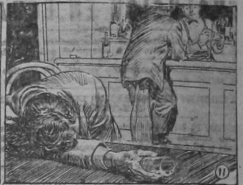
Toohy dijo: "Dios ha rechazado su ofrenda".