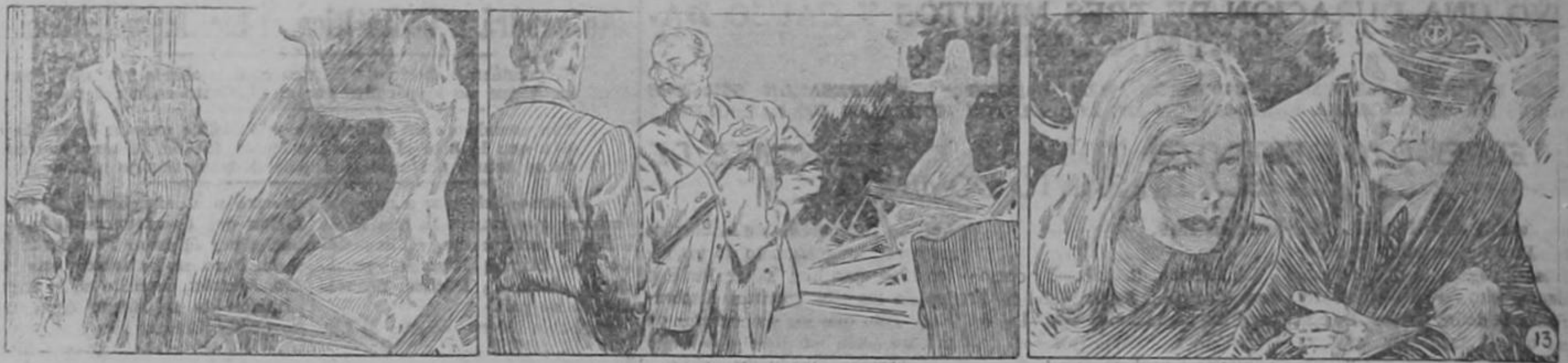
Gay Wynand miró la estatua.