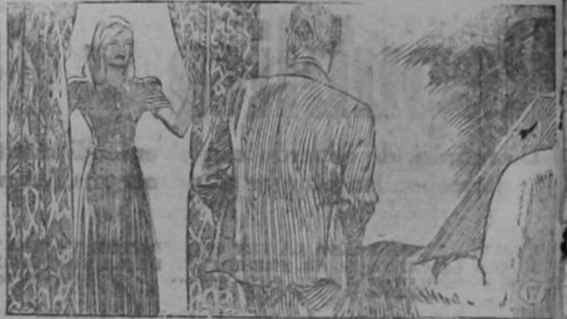
Roark escogió el lugar para la casa... —Me gustan muchísimo,—dijo Wynand fríamente