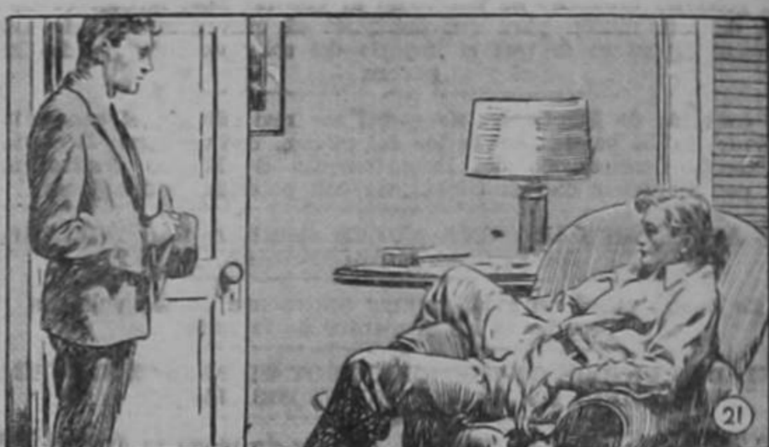
—Ahora soy libre, —le dijo Wynand a Roark.