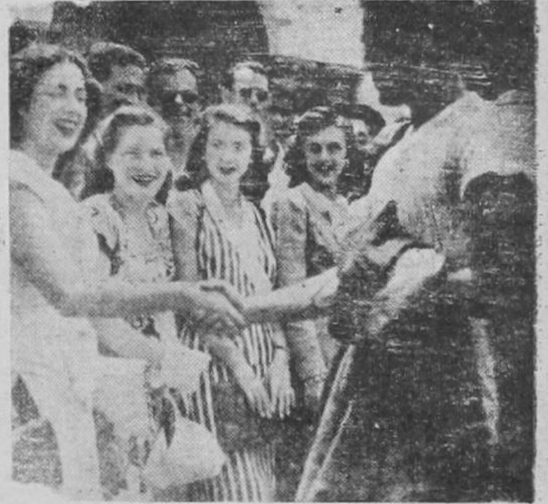
Momento en que Tyrone Power, el famoso astro del cine y del teatro de Estados Unidos es presentado a la encantadora, bella y exquisita MISS TRIBUNA, la señorita Aida Villalobos Dobles. Power no puede disimular que está un poco emocionado. No es para menos