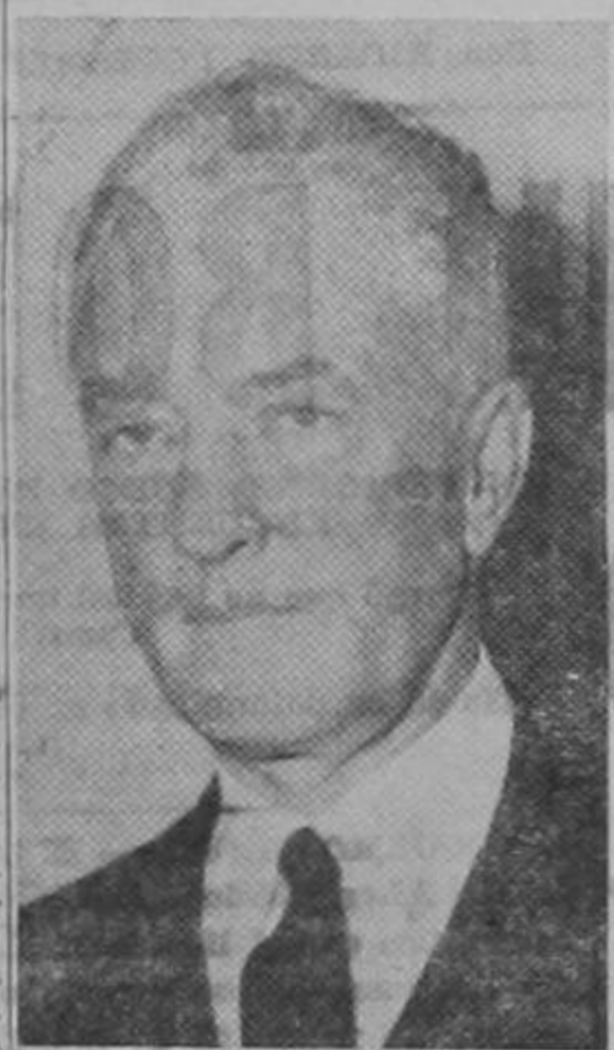
El Contralmirante Byrd

logrado conseguir nuevos datos y conocimientos científicos acerca de ese misterioso continente. Durante su último viaje (1939 a 1941) por ejemplo, descubrió cinco nuevas cordilleras, cinco islas, más de 259.000 kilómetros cuadrados de