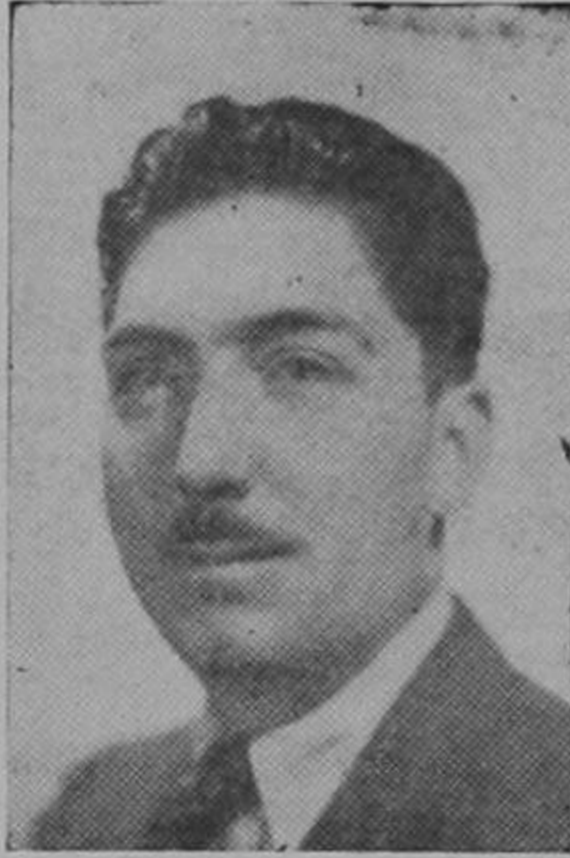
Lic. MIGUEL ALEMÁN

"Saludo cordialmente a los trabajadores representados en ese congreso y les expreso mis fervientes votos por la unificación de la clase trabajadora, por el progreso de las patrias a que pertenecen y por la solidaridad de las naciones del nuevo mundo. Miguel Alemán, presidente de México.