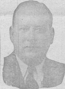
Gral. Don RENE PICADO

ULTIMA HORA, desde sus columnas, envía su más sincera salutación de bien venir al General Picado