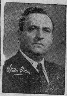
DR. CALDERON GUARDIA

Complacidos damos a conocer las noticias telegráficas recibidas: