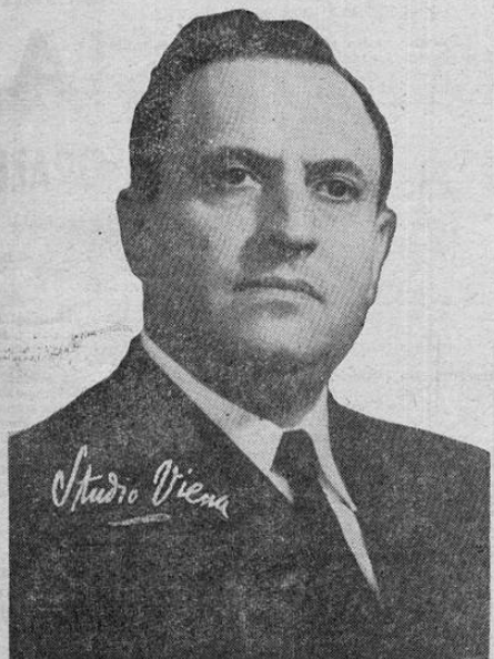
DOCTOR DON RAFAEL A. CALDERON GUARDIA

Con sus propios bienes indemnizaremos a las posibles víctimas y al Estado. Tenemos suficiente fuerza parlamentaria para hacerlo