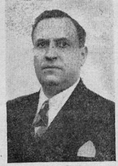
Dr. CALDERON GUARDIA