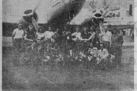
La delegación basketbolística norteamericana del STENOS de DAVENPORT posa exclusivamente para ULTIMA HORA al arribar ayer a las cuartos de la tarde en nuestro Aeropuerto Internacional de La Sabana.