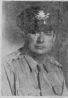
General RENE PICADO

Sensacional contestación del General René Picado a la truhfante información que reproduce esta mañana La Nación acerca de una supuesta entrevista del Sr. Srio. de Seguridad con el General Somoza