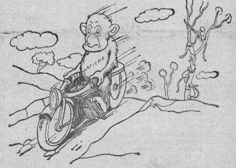
AL FINAL DE LA CUESTA, ESTA EL BARRANCO DEL DOMINGO...