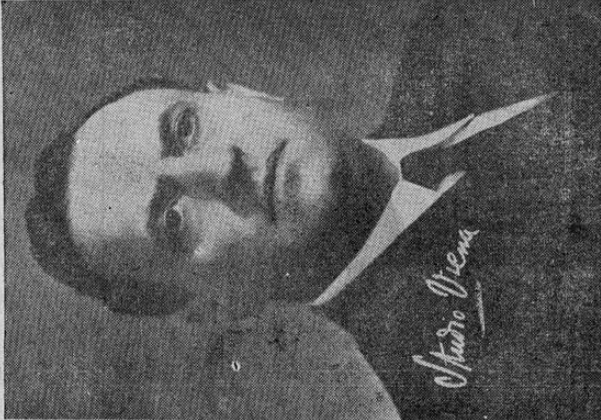
DR. DON RAFAEL ANGEL CALDERON GUARDIA

Los fraudes en este Cantón fueron tan asquerosos y temerarios que esta Junta Cantonal haciendo eco de la voz del pueblo se abstenió de hacer el escrutinio municipal como primer paso, en su consecuencia, se encontró mérito para arrollar del Registro Electoral a su Director lo hay asimismo para declarar fraudulentas las elecciones verificadas. Atentamente, Ced. 5887 Presidente Junta Cantonal