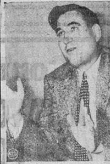
Jim Folsom, Gobernador de Alabama ha dicho a los reporteros que él desmentirá los cargos que sobre paternidad de un niño le han sido hechos y que estos son exclusivamente originados por la campaña política en que él está metido, siendo la acusación un método de sus enemigos para desprestigiarlo.