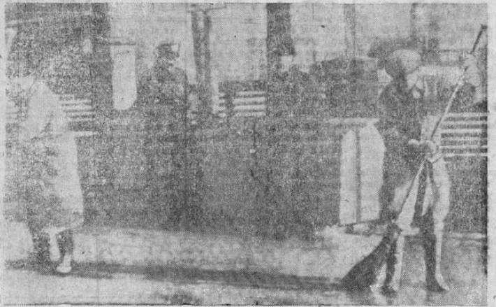
DOS GUARDAS de las fuerzas de Finlandia protegen a la Embajada Soviética en Helsinki. A pesar de que la mayoría parlamentaria está contra el tratado de mutua ayuda militar propuesto a la nación por el Mariscal Stalin, las autoridades cumplen con su deber de custodiar a la Embajada.