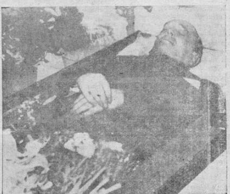
El cuerpo del que fuera Ministro de Relaciones Exteriores de Checoslovaquia, Jan Masaryk, y que puso fin a sus días lanzándose desde una de las ventanas del Palacio Cernin, en Praga, donde está instalado el Ministerio de Relaciones Exteriores.

publicado hoy por el diario L'Intransigeant de París. Informa asimismo el diario que el ministro de Relaciones Exteriores de Francia Georges Bidault y el primer Ministro de Italia Alcide de Gasperi conferenciarán esta mañana respecto a la ayuda que el gobierno de París podrá suministrar al de Roma en caso de que