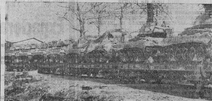
Este es el primer cargamento de tanques de guerra para el gobierno turco que se envía de los Estados Unidos. Puede verse el tren en que eran conducidos hacia el puerto de embarque.

41.111. Varese: Demócratas-Cristianos, 40.300, Frente Popular: 24.449. Brescia: Demócratas-Cristianos, 26.843, Frente Popular; 13.823. Monza: Demócratas-Cristianos, 12.933, Frente Popular; 9908, Chioggia: Demócratas-Cristianos, 8330, Frente Popular, 4609.