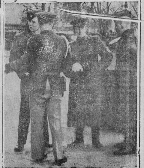
La gráfica recoge un momento dramático, cuando oficiales rusos y norteamericanos se encuentran, siendo detenidos los segundos para indicárseles que de acuerdo con las últimas disposiciones emanadas del alto comando ruso de ocupación, queda detenido el libre tránsito por la zona soviética

Vuele... por la línea aérea de mayor experiencia!