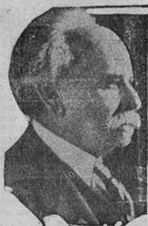
El profesor Franz Boas, notable antropólogo de la Universidad de Columbia, es el nuevo jefe de la Sociedad Americana en Pro del Adelanto de la Ciencia. Mr. Boas nació en Westphalia el 9 de julio de 1858, tiene grados honorarios de instituciones científicas de todas partes del mundo y es autor de numerosos trabajos de enseñanza sobre antropología