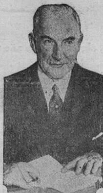
Henry P. Fletcher, ex-embajador en Roma y en distintos países de la América Latina, ha sido nombrado presidente de la nueva comisión de aranceles de los Estados Unidos