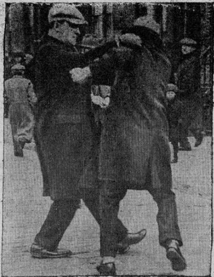
La policía puso término a los desórdenes provocados recientemente por los rojos en Brooklyn, New York. En la fotografía aparece uno de los fornidos policías en traje civil (el de gorra) sometiendo a uno de los desordenados. El entusiasmo de los comunistas se apagó pronto