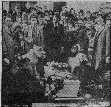
Este ataúd de terciopelo contiene los restos de "Unalaska" el perro cabeza de los trineos del Almirante Byrd durante su reciente expedición antártica, rodeado por algunos de los miles de niños y funcionarios oficiales que asistieron a los funerales del perro en Monroe, Louisiana, Estados Unidos