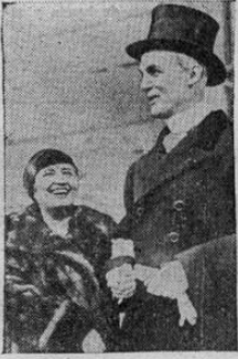
La condesa Matuschka, ex-Ella Walker, de Detroit, Estados Unidos, con su marido James Hazen Hyde, en la parte exterior del Hotel de Ville, en Versalles, Francia, después de haber contraído matrimonio. El ex-premier, André Tardieu, asistió al matrimonio