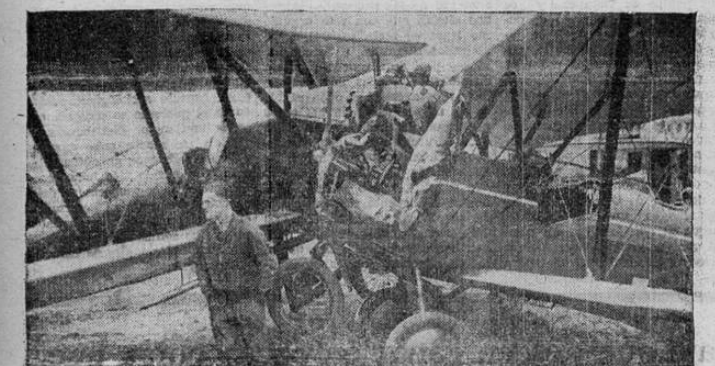
Estado en que quedaron estos dos aeroplanos de pasajeros al chocar en el aeródromo Roosevelt, New York. Tres personas resultaron heridas; pero, por suerte, nadie se mató.

—El impuesto es personal y para lograr lo que ustedes desean, no habría otro medio que hacer tributar como dueños a los apoderados, por más que personalmente tributan todos los empleados de esas empresas. —De suerte que usted cree que haciendo reformas vale la pena de implantar la cédula personal como tributo en estos momentos? —Pues no es lo más deseable; pero es urgente arbitrar fondos al tesoro por un millón de colones que necesita y no sé hasta cuándo pueda darse con otra fórmula menos incómoda. —Nosotros pensamos poner nuestro granito de arena para lograr lo, si es que don Tomás lo encuentra aceptable y no quiero oír. —Pues hombre, harían una gran labor que el país les reconociera. —Con que fuera capaz de reemplazar el de la cédula que no parece ser de mucha aceptación, es taríamos bien pagados, ya que un asentimiento de parte de don Tomás sería para nosotros del mayor mérito, le replicamos al despedirnos.