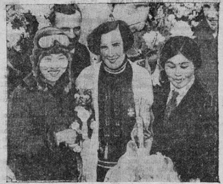
La señora Victor Bruce, al centro, notable aviatrix británica, a su llegada al aeródromo de Tokio, Japón, al terminar su vuelo desde Londres. La señora Bruce voló las 11.000 millas sola.