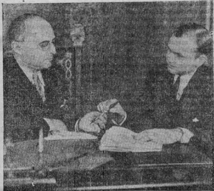
Earl Sande (a la derecha) el rey de los jockeys de los Estados Unidos, firmando un contrato para filmar una película, que se tomará en Brooklyn, Nueva York