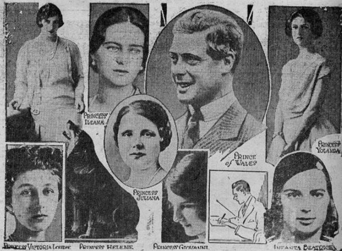
El viaje que realiza el príncipe de Gales a Sud América probablemente agregará un nuevo capítulo a su "Libro de No vias". Damos una serie de fotografías de todas las probables novias que se han atribuido al Príncipe. ¿Se seguirá atribuyéndosele novias durante su próximo viaje?