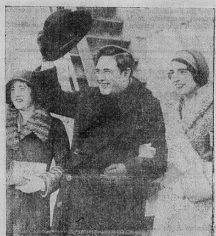
John McCormack, el famoso tenor, con su hija y su esposa, al regresar a los Estados Unidos en el vapor "Majestic" después de una gira de conciertos de nueve meses por Europa. Empezará su temporada de conciertos en los Estados Unidos en el Carnegie Hall

Comerciante, gane dinero suprimiendo al intermediario; aproveche su dinero obteniendo publicación a su anuncio en el periódico popular, a precio más bajo y con mayor espacio