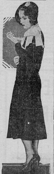
Los trajes de bolero estarán de moda en la primavera próxima. Aquí aparece uno de los primeros modelos, en crepé cantón, blanco y negro