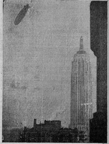
El dirigible de la marina americana, "Los Angeles", volando cerca de la torre del edificio Empire State, en Nueva York, como inspeccionando el mástil en que será amarrado en sus viajes a Nueva York. El mástil fue construido especialmente sobre el edificio que será el más alto del mundo, para el uso del dirigible