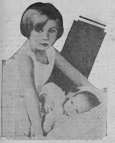
La princesa Josefina Carlota, al lado de su hermanito, no está en edad suficiente para darse cuenta de que se encuentra en compañía del futuro rey de los belgas, El Príncipe Baudouin y su hermanita son hijos del príncipe Leopoldo y la princesa Astrid, de Bélgica