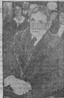
Elinor Root, el famoso ex-secretario de estado, al presentarse ante la comisión de Relaciones Exteriores del Senado de los Estados Unidos, para explicar las condiciones de la adhesión de los Estados Unidos al Tribunal Internacional de La Haya, contenidas en el protocolo que el negoció con otra naciones

Si esto sigue así, dijo uno de los maestros, habrá que declarar una franca hostilidad contra el ministro in... Justo, etc.