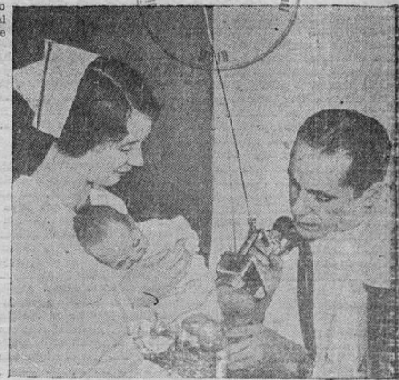
A fin de evitar la repetición de los cambios de criaturas recién nacidas en los hospitales, se ha adoptado el procedimiento de marcarlas con rayos de sol, artificiales. Aquí aparece un experto en rayos ultra-violeta y una enfermera marcando a un recién nacido con letras que le durarán diez días sobre la piel, o sea, hasta cuando la madre se encuentre en condiciones de hacerse cargo de él