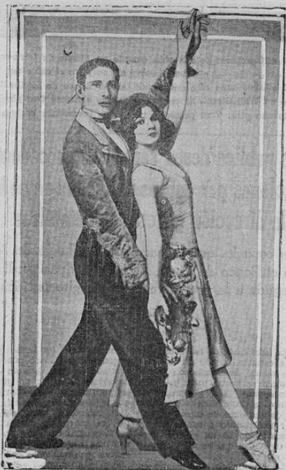
DARO y COSTA , famosos bailarines internacionales, quienes acababan de regresar a Norteamérica después de una triunfal tournée por los países de Europa. Ambos fueron condecorados por los reyes de Italia, para quienes dieron una función especial en el palacio real de Roma.