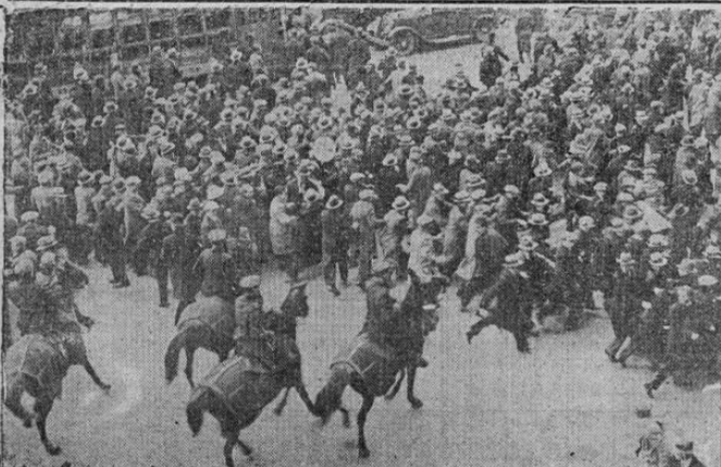
Fotografía tomada desde una elevación durante los desórdenes comunistas frente a la alcaldía de Nueva York. La policía montada aparece dispersando a los comunistas.

Esta idea ha nacido en la consulta que la secretaría de hacienda le hizo sobre si es el gobierno o el Banco de Costa Rica quien debe perder una cantidad de dinero pagada a la presentación de un giro falsificado