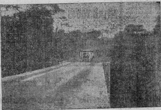
Carretera León-Telica. En el cuadro puede verse el asfalto de la vía al llegar al puente de Telica.

Muchachos y hombres sin trabajo que deseen ganar en pocas horas buen porcentaje, se necesitan con urgencia, en este periódico se informa