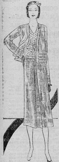
Modelo de Patou. Blusa bolero con fondo beige. A pesar de su sencillez, es de una elegancia exquisita.

Esa marcha ha sido compuesta por el señor Cantillano en honor a los socios jugadores de la Sociedad Gimnástica.