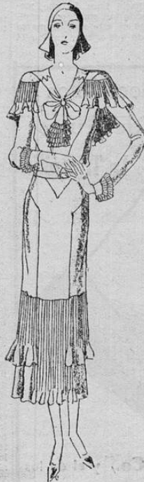
Este traje de sarga azul marino, especial para la tarde, lleva el cuello y la parte inferior de la falda plisados, corbata y puños de organdía. Sus líneas son a la vez elegantes y severas.