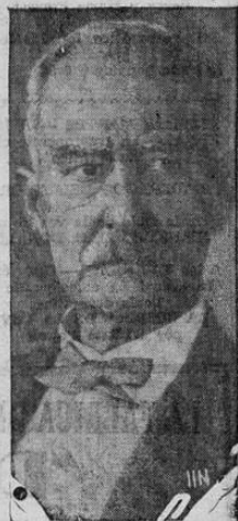
El ex-Secretario del Interior norteamericano Albert B. Fall, tan conocido por su participación en los escándalos petroleros que tuvieron resonancia mundial,