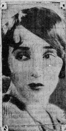
Bebe Daniels, la bellísima artista de cine, se ha declarado gran entusiasta de la aviación. Gran parte de su tiempo libre lo emplea en hacer vuelos sobre California

una casa en el barrio del Carmen en el Catedral, hipotecada a largo plazo, con gravamen no mayor de ₡ 10,000.00. Avise al apartado 1394.