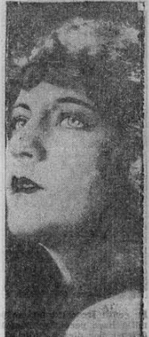
Estudio reciente de la hermosa artista de cine, que tantas simpatías goza de nuestro público.

Enviamos la más ferviente felicitación al señor Zelaya, al gobierno de Honduras que ha sabido interpretar un justo sentimiento de deber, y al señor Zumbado, que ha visto, con la atención del gobierno hondureño, coronados con el más bello de los éxitos, uno de sus nobles y frecuentes gestos de sincera fraternidad.