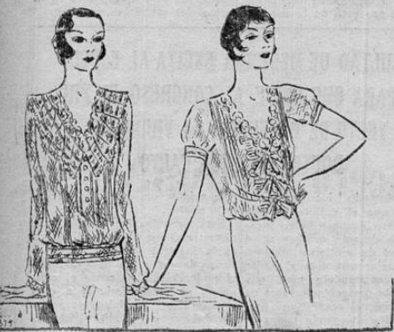
La blusa adquiere enorme importancia en las modas de primavera. Aquí vemos dos modelos, de cuello amplio y discretamente adornado