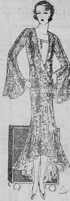
Este modelo es especial para soirees. Nótese que la falda es alargada por la parte posterior. La tela va adornada de flores.