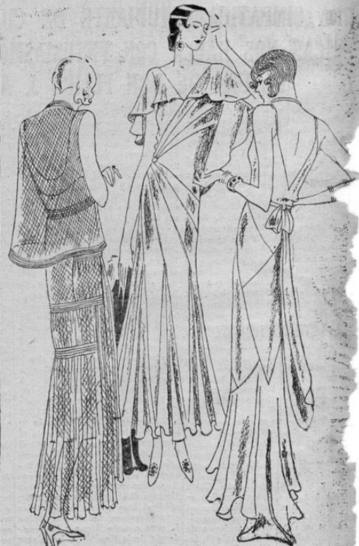
Este conjunto podría llamarse el de las tres gracias. A la izquierda vemos un modelo lucido por Irená Dana, estilo holero; al centro, modelo Redfern, de líneas muy originales; a cha, un modelo de London Trades, de