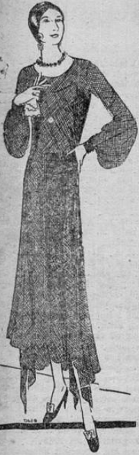
En este modelo se utiliza la seda de un color oscuro. Las mangas son abombadas y la cintura tallada.