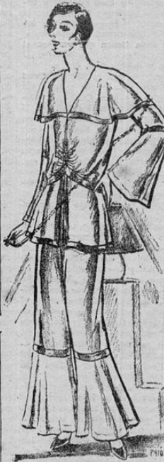
En este modelo se destacan el cuello ancho, las mangas de campana y la forma típica de la falda. Es de satín, con adornos de terciopelo.