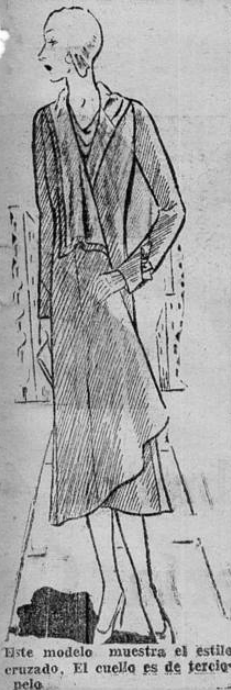
Este modelo muestra el estilo cruzado. El cuello es de terciopelo.

Hoy en la mañana se nos informó del hospital que el estado de los heridos no presentaba ninguna característica grave.