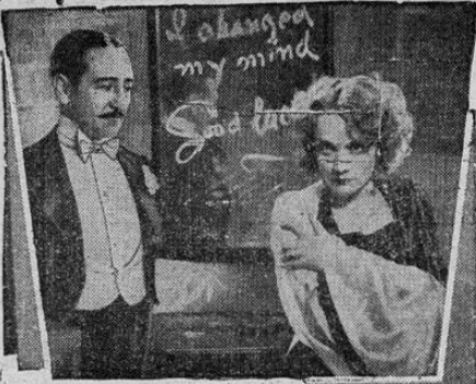
Adolphe Menjou, Mariene Dietrich in the Paramount Picture "Morocco". A Josef von Sternberg Production

Mariene Dietrich, Gary Cooper y Adolfo Menjou, en la gran producción que estrena el Teatro Raventós el domingo: Marruecos