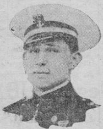
JUAN Carlos Eduardo Jorge de Borbón, tercero de los hijos varones de los ex-reyes de España en quien don Alfonso ha determinado hacer abdicación de los derechos de la corona de España.

La opinión íntima de don Alfonso es que por ahora no hay perspectiva de restauración monárquica. Aun que tiene esperanzas en una posible división entre los republicanos, en un movimiento separatista violento de una o más