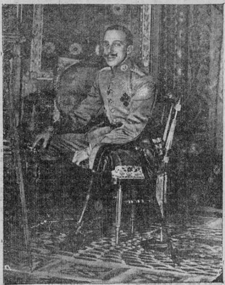
El ex-rey Alfonso que persiste en su determinación de abdicar de sus derechos a la corona de España en favor de su hijo el infante don Juan cuando este cumpla su mayor edad.

El exmonarca señala como su heredero en la corona al tercero de sus hijos, porque el primogénito o sea el Príncipe de Asturias, está incapacitado físicamente por la incurable hereditaria que padece, y el segundo, don Jaime, es sordo mudo de nacimiento. En cambio don Juan, al igual que su otro