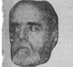
DON JOSE Sánchez Guerra, a quien el rey designa como jefe del partido monárquico español y que, según los cables de LA HABANA de hoy tuvo ayer una interesante entrevista con Alcalá Zamora a propósito de las elecciones.

gros y designar como tal a don José Sánchez Guerra.