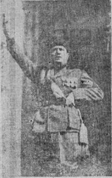
EL DUCE MUSSOLINI

Francia e Inglaterra han convenido no hacer empréstitos a Italia, hasta que el Duce llegue a un acuerdo con Francia en la cuestión naval y forme parte del pacto naval de las cinco potencias en Londres. Ese es uno de los "murmullos" que son el secreto del cambio de la actitud de Mussolini. América de Europa es tan seria y com-