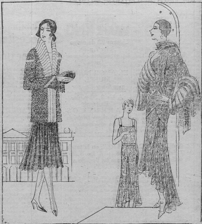
Los abrigos de pieles cortos, especiales para la calle, como el de la izquierda, goza de gran fa-