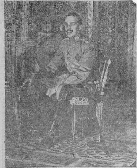
EL EX-REY ALFONSO XIII

En medio del mar nos preguntábamos si había que intentar dirigirse a la bocana del Arsenal, en donde por la tarde había entrado el "Cervera" al fondo de la bahía libre en donde se vislumbraban o-