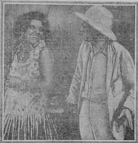
Scene from "Golden Dawn" - A Warner Bros. Production

ABRAHAM LINCOLN , la gran reconstrucción histórica, en tanda de 7 del gran Teatro Raventos :- En la función de 8.30 un gran estreno: "AMOR DE DIOS" con la bellísima cantante Vivienne Segal