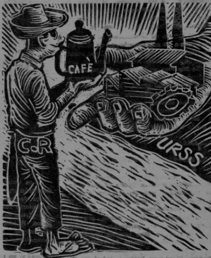
Café de Costa Rica puede traducirse en maquinaria e industrialización

de comprarnos el capitalismo. Podremos vender café, azúcar, cacao, maderas, abacá, carne, frutas etc. Podremos abrir nuevos cultivos en tierras incultas o en sustitución de cultivos improductivos que ya existan. Todo eso lo podremos hacer en la medida que se quiera. (—Pasa a la Pág. 7ª—)