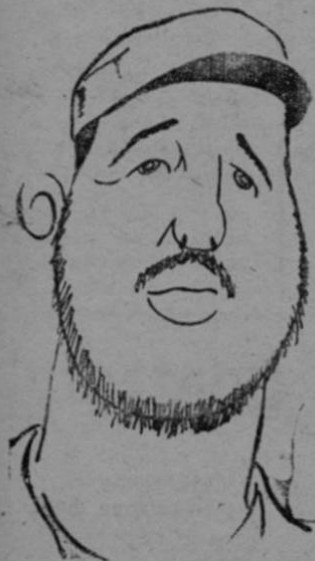
Dr. FIDEL CASTRO

QUE VENGAN LOS INVASORES EL DIA QUE SEA, HOY O DENTRO DE UN MES, PARA QUE VEAN CON QUE FURIA EL PUEBLO LES CAERA ENCIMA, DIJO FIDEL CASTRO EN UN GRAN ACTO EN LA CTC