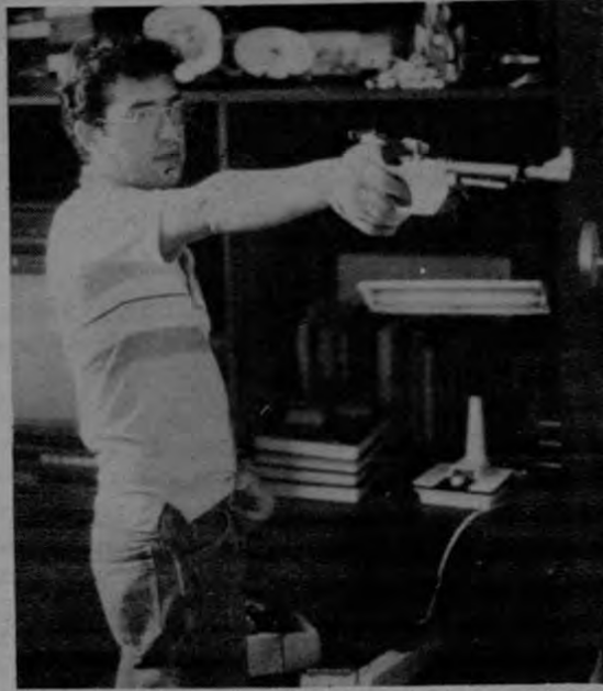
"Es muy difícil pronosticar lo que va a ocurrir en Seúl".