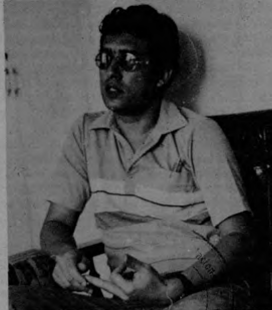
"En última instancia es la estrategia mental la que triunfa".

leta espera de su participación en Seúl y nos indica que cualquier pronóstico que hiciera al respecto no sería serio, por la cantidad de circunstancias que entran en juego.