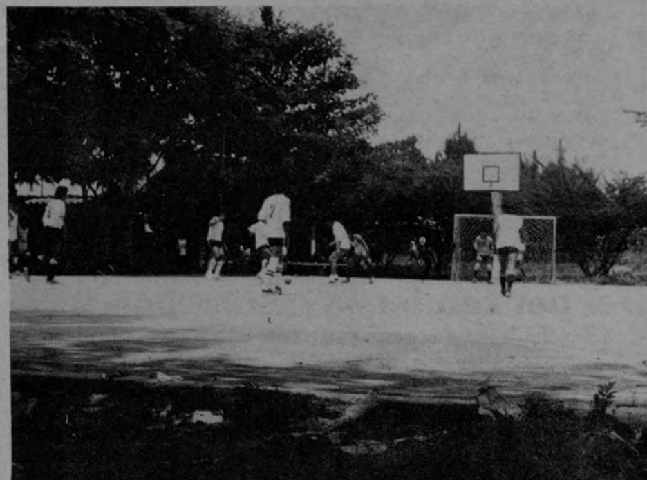
Competencias de volleyball femenino y masculino, de fútbol, de papifútbol y de ciclismo infantil reunieron a cientos de vecinos del cantón de Pococí.