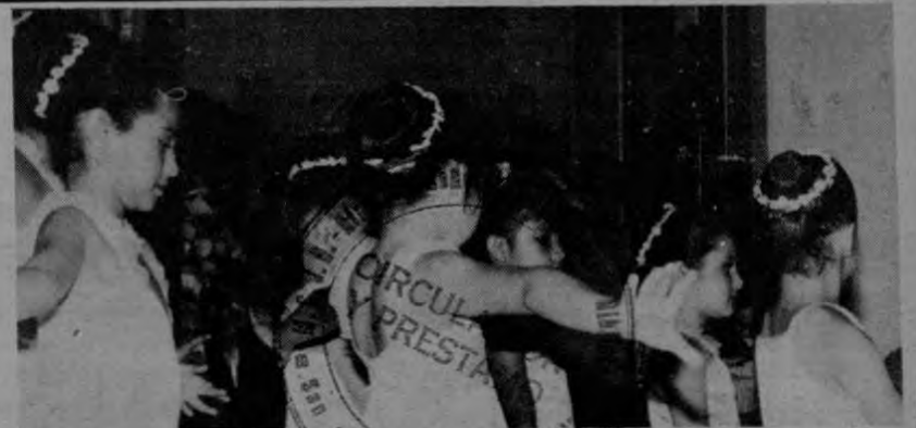
Los niños unieron las culturas costarricense y soviética.

Instituto Cultural Costarricense Soviético Invita a la próxima película "La vida, las lágrimas y el amor" Jueves 1º de setiembre, 7 de la noche -Entrada gratuita-