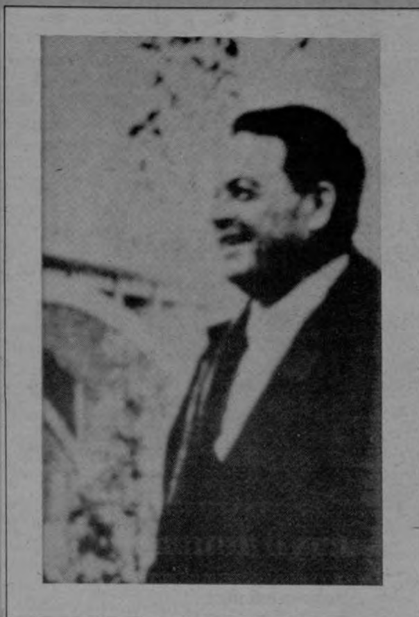
CARLOS LUIS FALLAS