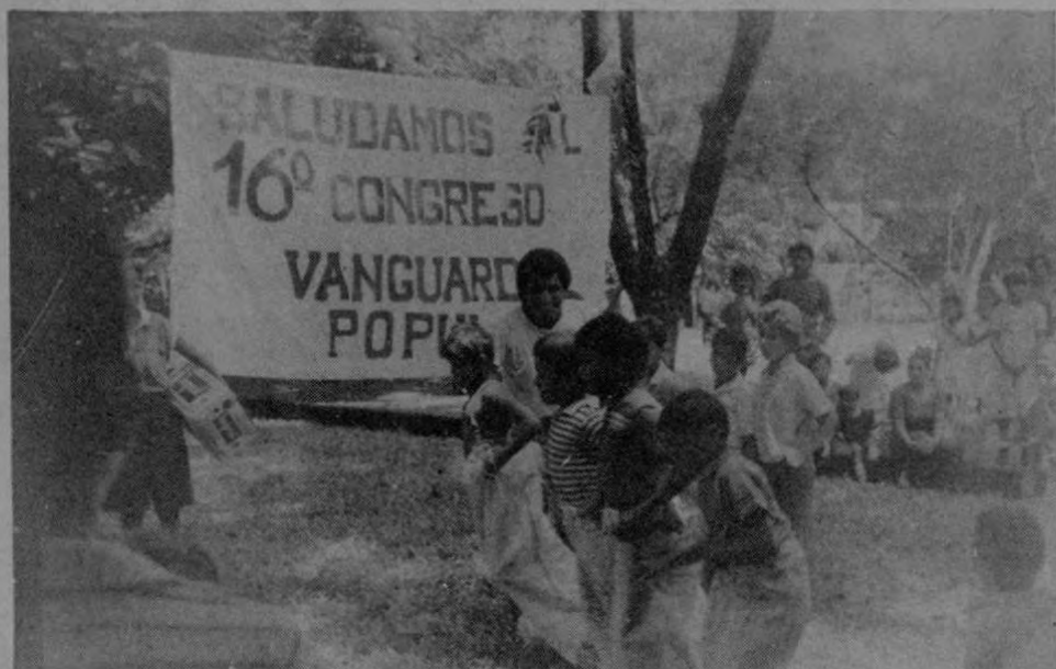
Los niños festejaron la realización del 16 Congreso con la tradicional carrera de sacos.