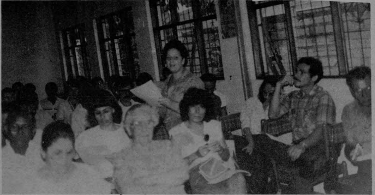
Buena parte de la asamblea fue consumida por la intervención de los delegados para hablar en favor de sus candidatos.

Destacó en el acto la participación del grupo musical Libertad, integrado por jóvenes músicos de Acosta y finalmente, se efectuó un alegre baile.