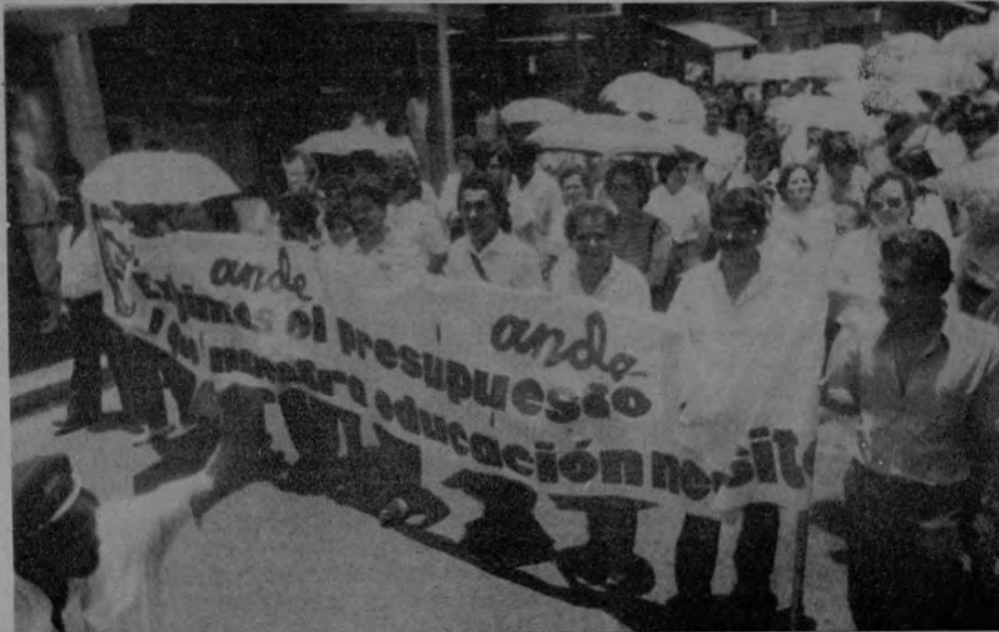
Los educadores volverán a tomar las calles de San José si el Ministerio de Hacienda no responde satisfactoriamente a sus demandas.

El tema de las pensiones y del pago de los salarios constituyen los elementos más importantes del pliego. Si la respuesta ministerial fuera negativa, el Consejo Intermagisterial Asociado (CIMA), integrado por todas las organizaciones sindicales que cubren el Magisterio Nacional, promoverá acciones de más fuerza en defensa de los intereses de sus agremiados.