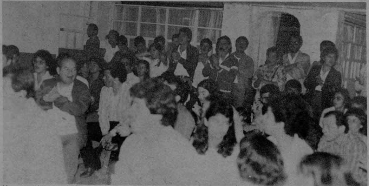
Un combativo acto con participación de militantes, afiliados y amigos cerró la asamblea del regional y el homenaje al Congreso.