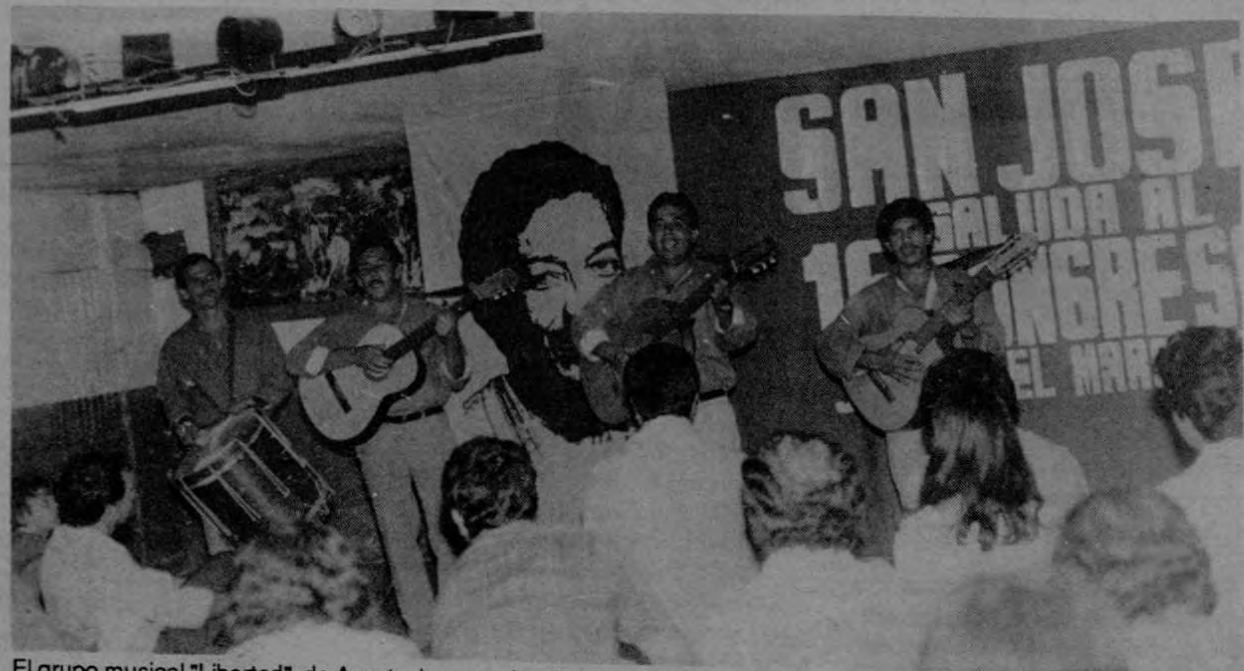
El grupo musical "Libertad", de Acosta, le puso alegría a la celebración del homenaje al Congreso.