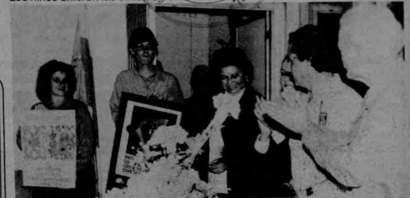
El presidente del ICSS (al centro en la presidencia) hace entrega de los premios a los dos primeros lugares del concurso de afiches del 15 aniversario de la institución.