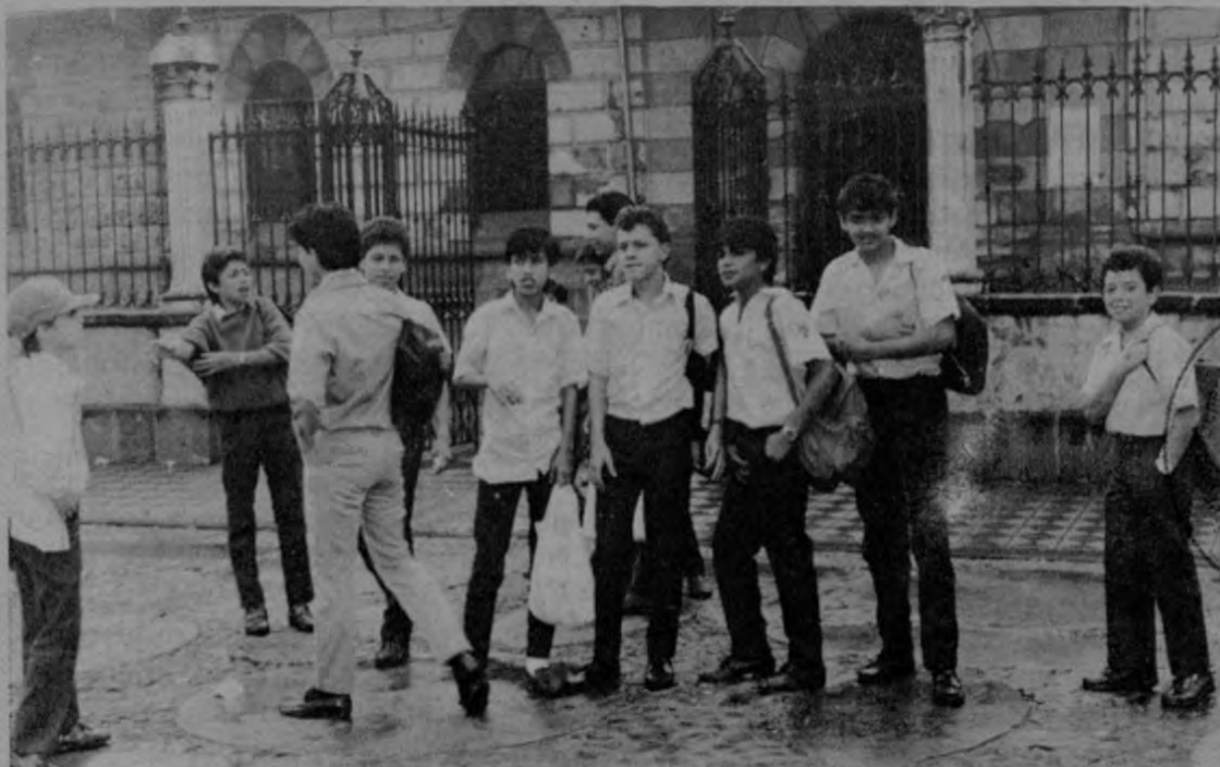
No existen condiciones para que este año se pueda realizar un examen de bachillerato serio, y por eso profesores y estudiantes se manifiestan en contra.

Pese a las presiones del Ministerio, denunciadas por dirigentes estudiantiles y magisteriales, en muchos centros educativos del país los estudiantes fueron al paro.