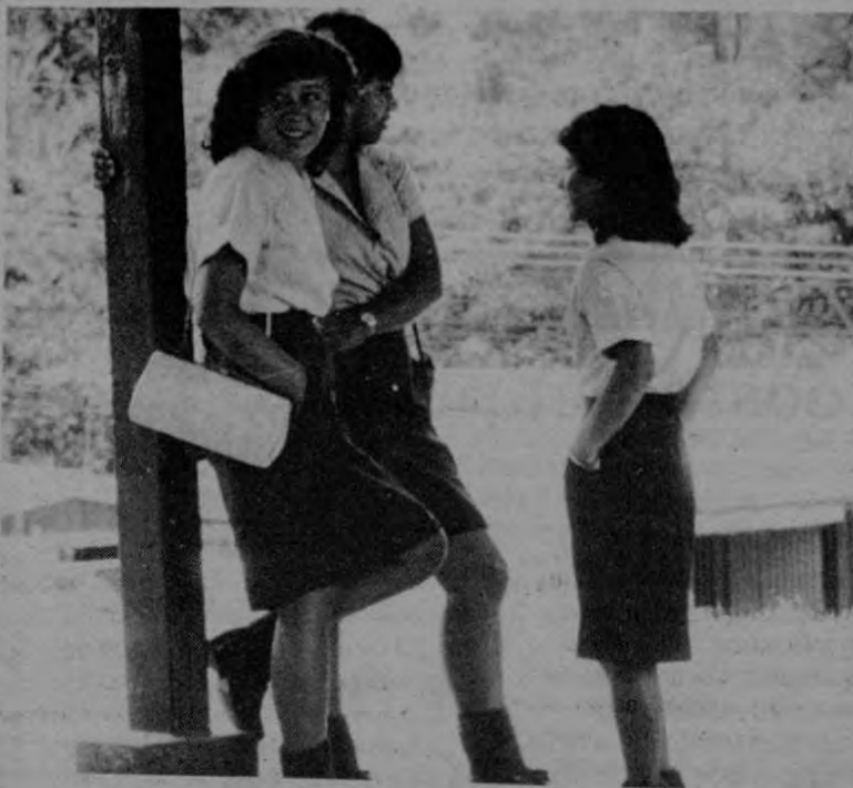
Los dirigentes de APSE han subrayado que no hay libros, textos y materiales para realizar las pruebas de bachillerato este año.