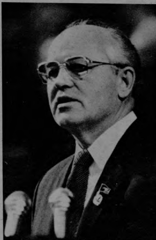
Mijail Gorbachov, secretario general del PCUS