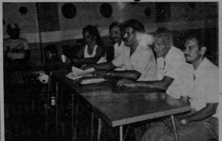
Dirigentes comunales de Siquirres.

La lucha del pueblo siquirreño por quitarse de encima los medidores de agua culminó exitosamente con un acuerdo firmado por los representantes populares y el Gerente de Desarrollo del Aya.