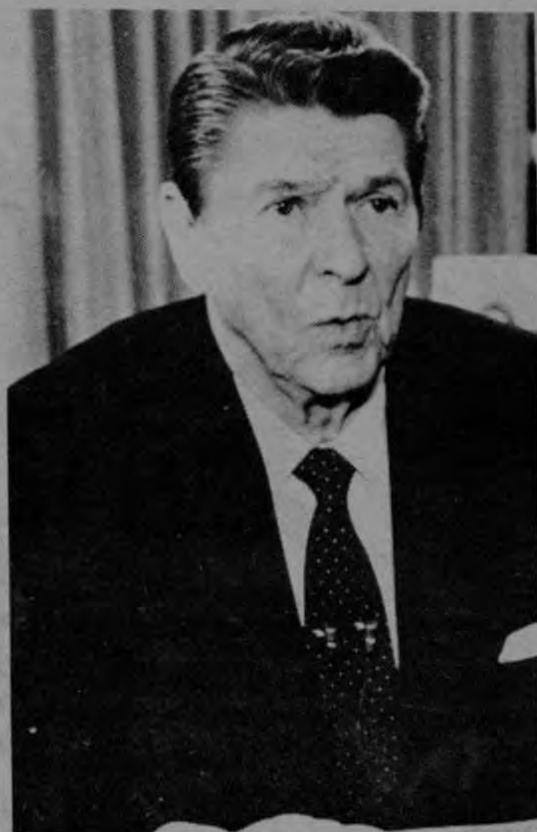
Ronald Reagan, presidente de Estados Unidos

Durante toda esta semana, la humanidad ha estado pendiente de la reunión cumbre que realizan el Secretario General del Partido Comunista de la Unión Soviética, Mijail Gorbachov, y el Presidente de Estados Unidos, Ronald Reagan. Al cierre de nuestra edición (miércoles), todavía no se han producido acuerdos concretos sobre los temas fundamentales en discusión. Ofrecemos un resumen de algunos de los aspectos más relevantes ocurridos en la Cumbre, transmitidos por las agencias TASS y Prensa Latina.