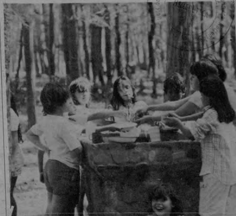
Bajo el lema "Juguemos a la Paz" unos cuarenta niños de la Unión de Pioneros Carmen Lyra participaron en un campamento en el parque Charrara, del 17 al 19 de febrero. Las actividades incluyeron visitas a lugares históricos cercanos al parque, como el museo y la iglesia de Orosi, las ruinas de Ujarrás, la Basílica de la Virgen de los Angeles y las ruinas de Cartago.