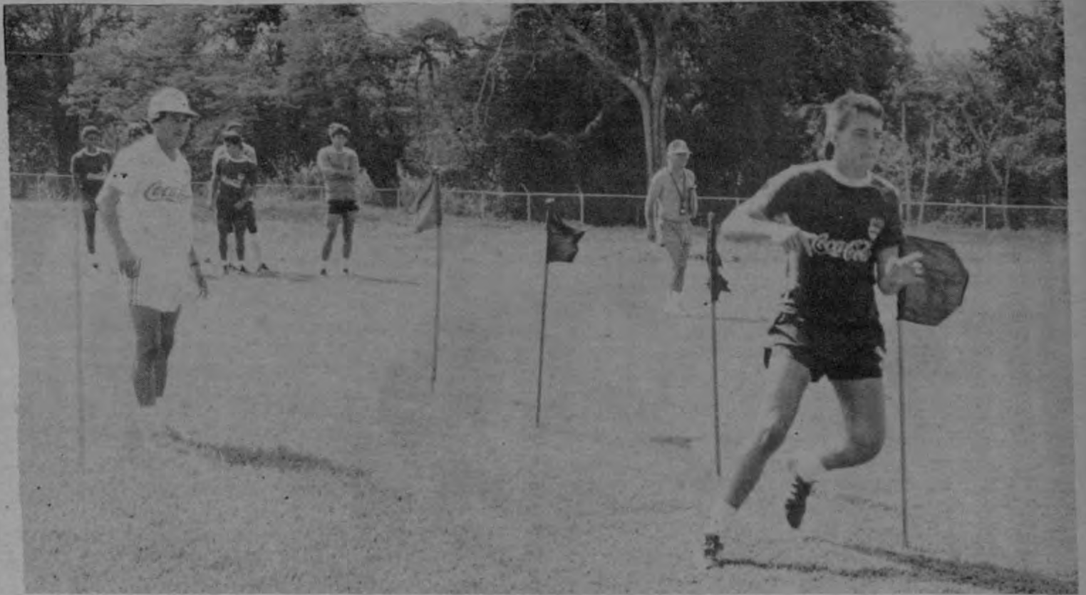
Muchos meses de duro entrenamiento condujeron a la Selección Juvenil a un buen desempeño en el Mundial de Arabia Saudita.

Colombia, la otra clasificada perdió con la URSS (3a1), con Costa Rica (1 a 0) y derrotó a Siria (2 a 0). El gol contra la Unión Soviética, le valió su clasificación aunque empatara en puntos con Costa Rica y Siria.