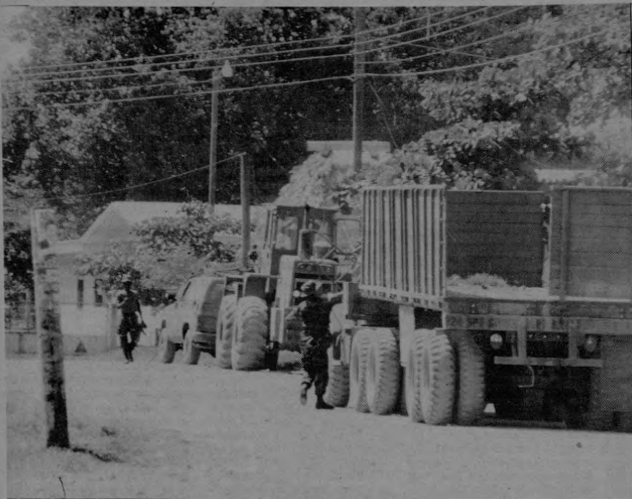
Puerto Jiménez : monstruos bélicos cambiaron la fisonomía de este pueblo tranquilo

Los pacíficos pobladores de la Península de Osa (Zona Sur del país) vieron de pronto modificados sus hábitos de vida cuando alrededor de mil soldados norteamericanos de los llamados cuerpos de ingeniería militar hicieron aparición en sus tierras.