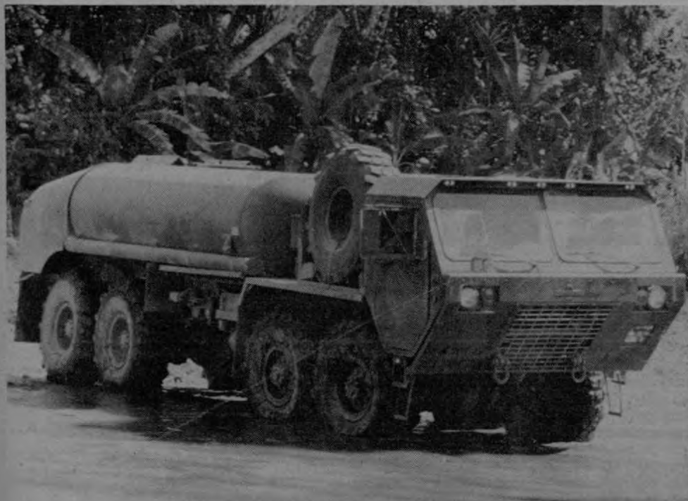
La presencia de los ingenieros militares forma parte de la estrategia global de los Estdos Unidos en Centroamérica

Esta es la más numerosa de las delegaciones militaristas enviadas por los Estados Unidos en toda nuestra historia.