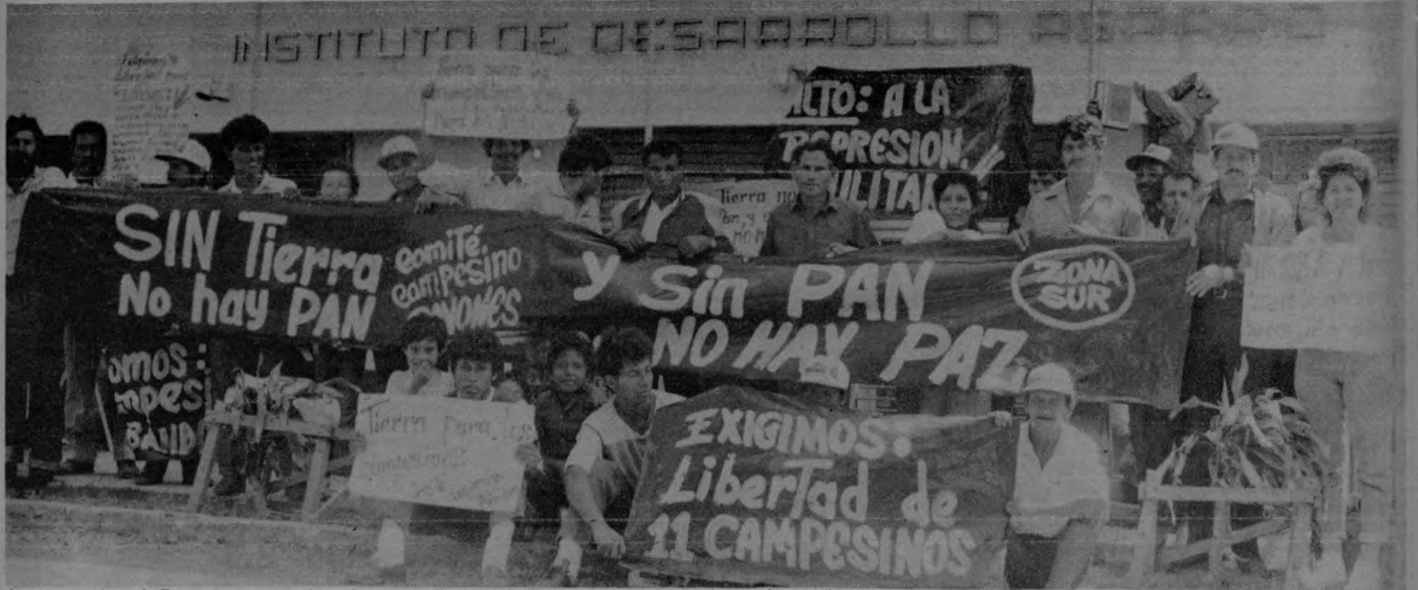
Los campesinos de Pavones se mantuvieron frente al edificio del IDA hasta que conocieron el acuerdo que pide la expropiación.

El acuerdo adoptado el martes por la Junta Directiva solicita la expropiación de todas las fincas ocupadas por campesinos, inscritas a nombre de narcotraficantes extranjeros