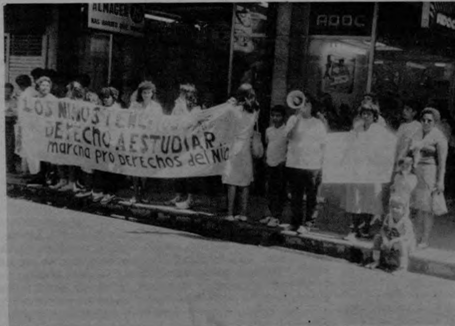
Frente a las oficinas del MEP, padres de familia del Cantón de Alajuelita demandaron construcción de escuela para 650 niños sin matrícula.

traba en ese acto de protesta para defender el derecho de sus nietos. Afirmó que desde hace años la AID había donado 10 millones de colones para la compra de un terreno y la construcción de varias aulas. Sin embargo, hasta ahora no sabemos qué pasó con ese dinero, dijo.