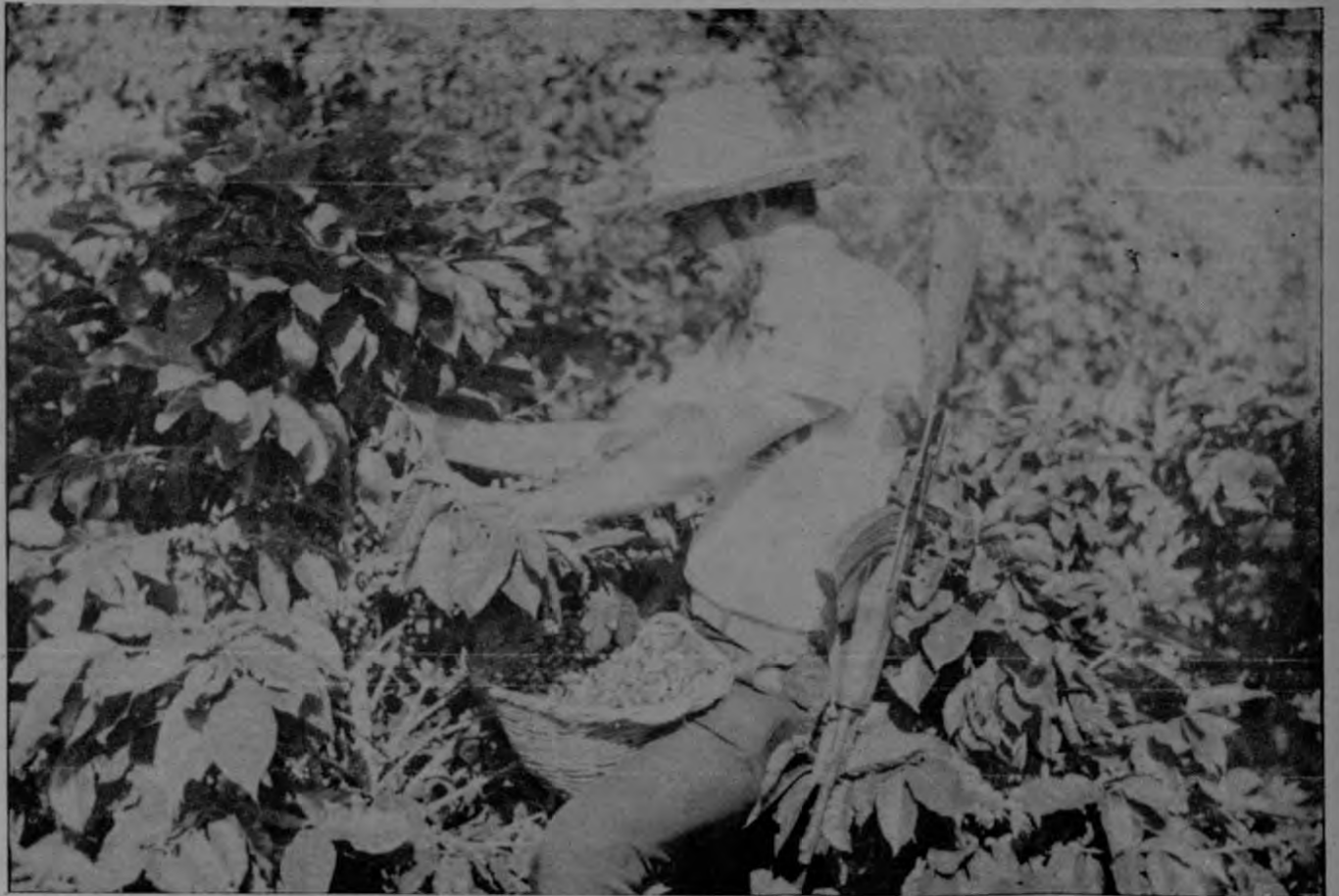
El avance del proceso de paz habilita nuevas tierras en el norte nicaragüense, adonde se dirigen ciudadanos sin empleo de las ciudades.

La economía nicaragüense está basada en la explotación agropecuaria, de donde procede un 70% de las divisas que capta el país por sus exportaciones y se producen los alimentos básicos de la población.