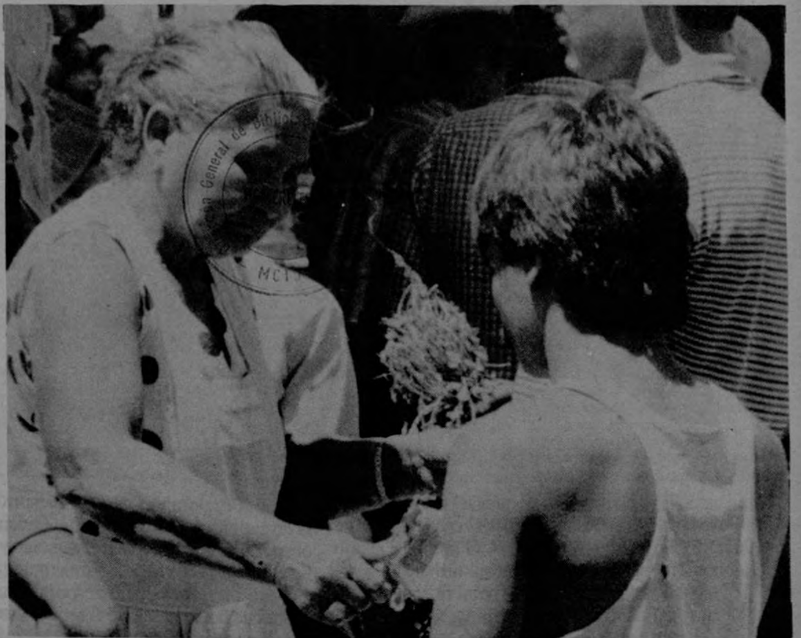
¡Pero si le di un billete de cien! ¿No ve qué vueltillo? ¿Y ahora qué hago pa' comprar lo que me falta?

Las imágenes fueron captadas a las once de la mañana, pero el trajín comienza antes de que salga el sol y permanece hasta avanzada la noche. Aquí confluyen las angustias del ama de casa que tiene que comprar más caras las cosas, aunque sus ingresos no se estiren, con las congojas de los vendedores que también compran más caro. Aquí se repite miles de veces la disputa por el comprador y la disputa por el precio. Pero el que sube los precios está ausente, sentado en un sillón de un banco, sumergido en playas lejanas o abordando el flamante carro de ministro.