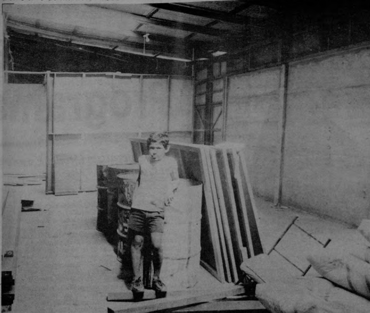
En un galerón incómodo los niños tienen que recibir lecciones.