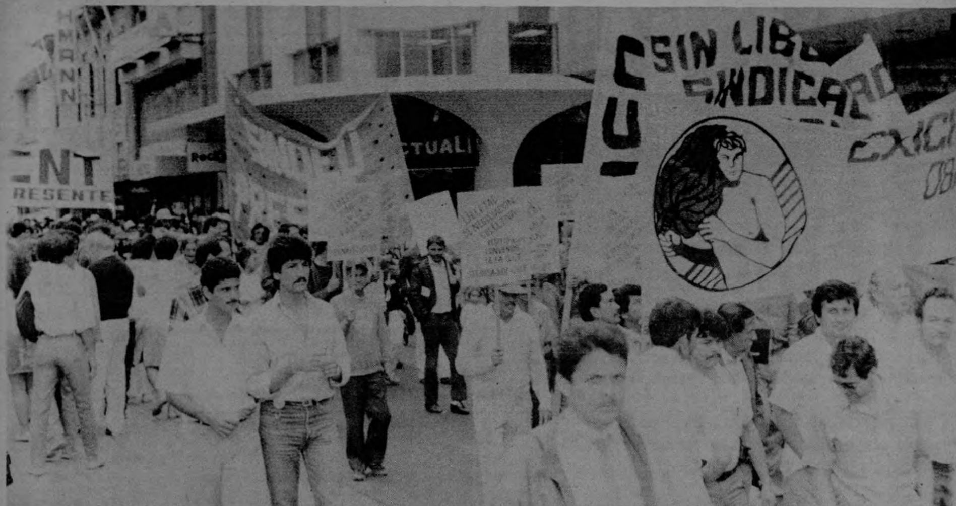
Dirigentes sindicales desfilan por la Avenida Central de San José y se dirigieron a la Asamblea Legislativa exigiendo respeto al derecho de organización sindical.