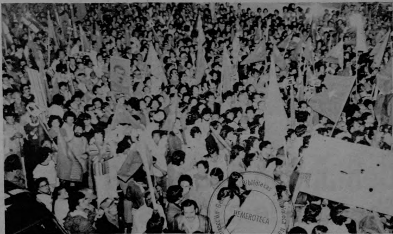
Todos los partidos políticos deben contar con igual espacio en los medios de comunicación durante las campañas electorales. El día de los comicios el transporte debe ser organizado por el Tribunal Supremo de Elecciones.

Que en forma definitiva no puedan ocupar cargos de elección popular, ni puestos públicos, los ciudadanos que hubieren sido condenados por delitos de peculado, enriquecimiento ilícito, evasión de impuestos, desacatos a las disposiciones y fallos del Tribunal Supremo de Elecciones y Narco-