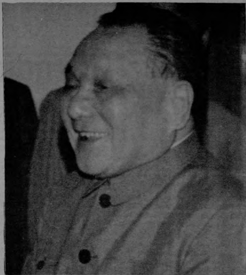
El dirigente chino Deng Xiaoping recibió al presidente Bush durante la visita de este a China.

Al referirse a las relaciones entre los EE.UU. y la Unión Soviética y las de China y la URSS, Deng Xiaoping expresó su acogida al tratado sobre proyectiles de medio alcance entre los EE.UU. y la URSS y deseó que se realicen progresos en sus negociaciones respecto a la reduc-