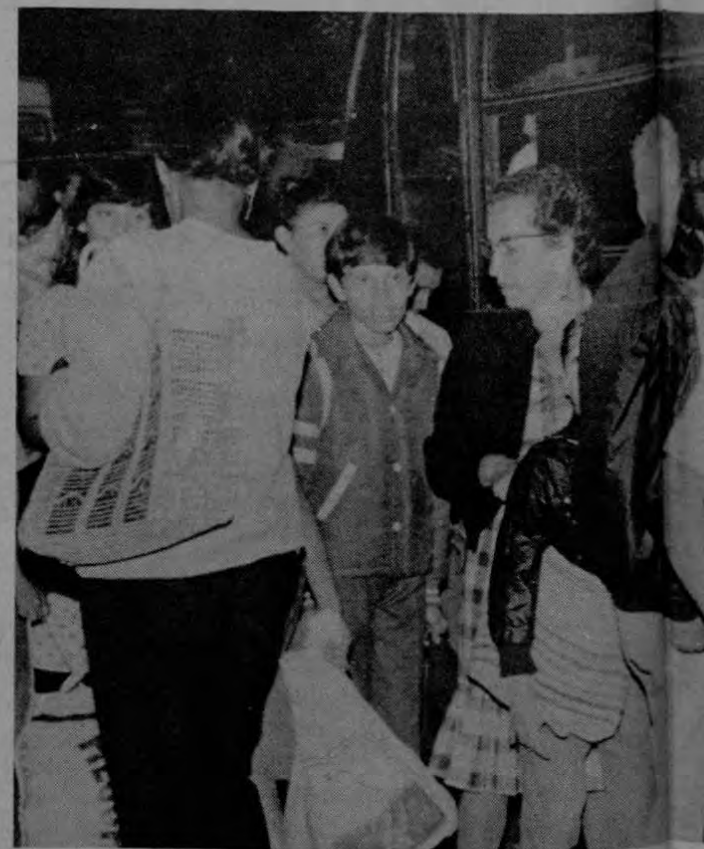
El transporte público, la apertura y mantenimiento de caminos y el control de las municipalidades. Hay que garantizar el financiamiento del ejecutivo municipal debe hacerse por voto popular.

Nosotros hacemos objetivo de nuestra lucha política, la defensa del legítimo derecho de nuestro pueblo a disfrutar de los siguientes derechos humanos: 1- Derecho a la vida, a la libertad y a la seguridad personal. 2- Derecho a la igualdad ante la ley. 3- Derecho a la libertad de culto religioso. 4- Derecho a la libertad de investigación, de opinión, de expresión y de divulgación (divulgación). 5- Derecho a la protección del honor y a la reputación personal y de la vida privada y familiar. 6- Derecho a tener una familia y su protección. 7- Derecho a la protección para madres e hijos. 8- Derecho a la residencia y al movimiento. 9- Derecho a la inviolabilidad del hogar. 10- Derecho a la inviolabilidad y transmisión de correspondencia. 11- Derecho a la preservación de la salud y del bienestar. 12- Derecho a la educación. 13- Derecho a los beneficios de la cultura. 14- Derecho al trabajo y a una remuneración justa. 15- Derecho al tiempo dedicado al ocio y al uso de él. 16- Derecho a la seguridad social. 17- Derecho al reconocimiento de la personalidad jurídica y de los derechos civiles. 18- Derecho a un juicio justo. 19- Derecho a la nacionalidad. 20- Derecho a votar y participar en el Gobierno. 21- Derecho de reunión. 22- Derecho de asociación. 23- Derecho de propiedad. 24- Derecho de petición. 25- Derecho a protección contra un arresto arbitrario. 26- Derecho a un debido proceso legal. 27- Derecho de asilo.