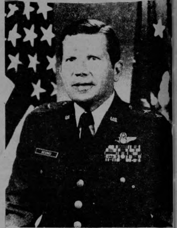
El mayor general (retirado) Richard Secord, fue uno de los iniciadores de la "empresa" secreta de la CIA.

"Esta misma tarde, Monge, Francisco Tacsan, y un consejero del Ministerio de Seguridad Pública asociado con el grupo terrorista de los "babies", y otros funcionarios se reunieron con varios delegados de ARDE,