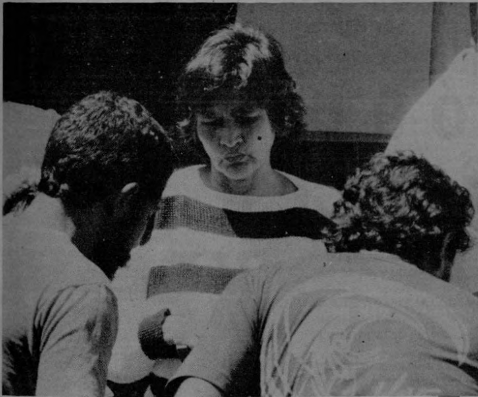
¿Qué? ¡Pero si ayer...! ¡P...!