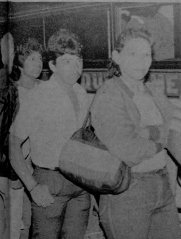
El mismo que otros servicios públicos deben estar bajo el control de los gobiernos locales y su autonomía. La elección

l- La constitución por parte de varios gobiernos municipales de las asambleas provinciales y el establecimiento de niveles de coordinación para la ejecución de los que corresponda del Plan Nacional de Desarrollo.