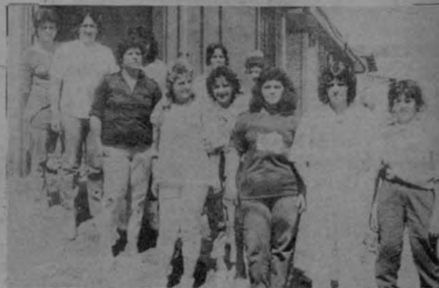
Las madres estuvieron dispuestas a ir a huelga de hambre para conseguir una escuela para sus hijos.

Los organismos del gobierno se comprometieron a entre-