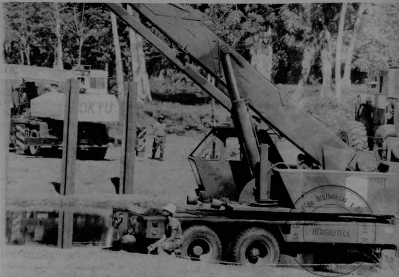
La construcción de siete puentes es solo una excusa para entrenar a las tropas norteamericanas.

Por otra parte, el diputado agregó que no se han dado a co-