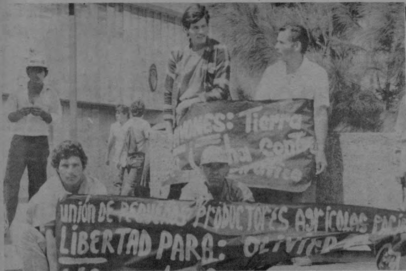
Frente a la Corte Suprema de Justicia los campesinos exigen la libertad de sus compañeros detenidos