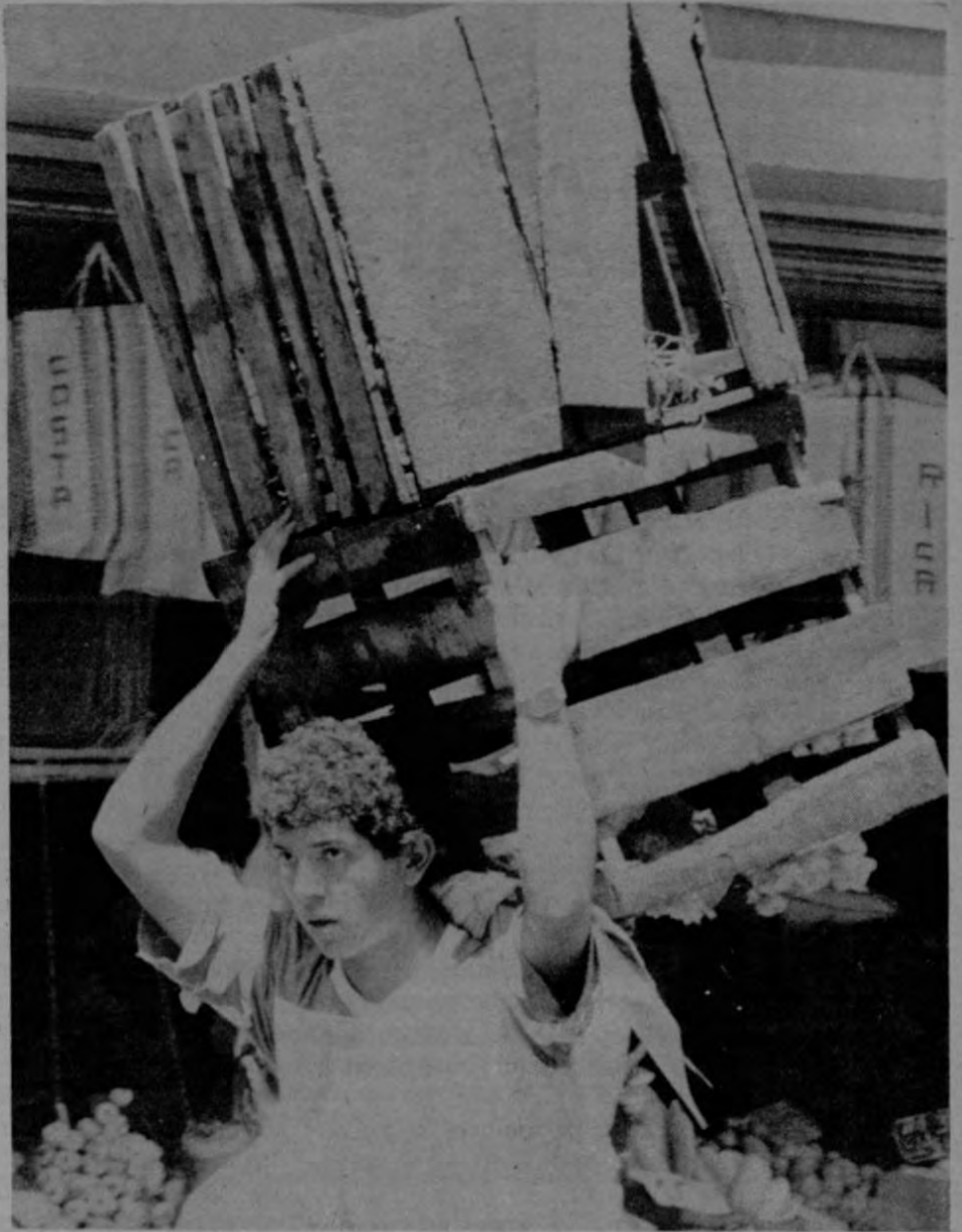
Muy temprano se comienza y muy pesada es la carga.