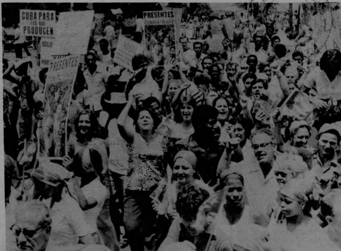
El apoyo militante del pueblo cubano a su revolución es la mejor muestra del respeto de su gobierno a los derechos humanos.

En las cárceles cubanas no han casos de torturas ni tratos inhumanos o degradantes y los funcionarios penitenciarios tienen instrucción de no cometer ningún tipo de atropellos contra los pre-