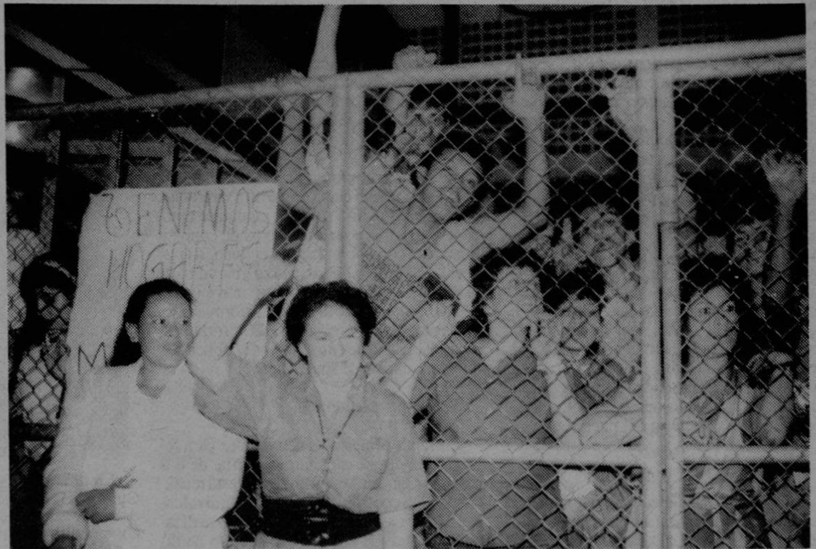
Trabajadores tomaron la fábrica no permiten la salida de mercaderías ni maquinaria, pues consideran que esta es la única forma de que les paguen los salarios adeudados y las otras garantías sociales a que tienen derecho.

Según información suministrada por la dirigente sindical hay una lista de empresas que pronto se van a declarar en quiebra, "la Leonisa, fábrica de ropa íntima, ha cerrado algunos departamentos, líneas que ellos consideran que no tienen la misma venta de antes; por otro lado la H.D.LEE que es una fábrica de pantalones de mezclilla, la Pegasso ha cerrado algunos departamentos también, Lomas de Arena es otra que está en la misma situación que Caballero Blanco. Así como estas hay una lista mayor de fábricas en peligro y para los trabajadores no hay legislación que los proteja".