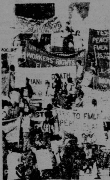
Protesta frente al Capitolio por política de EE.UU. para El Salvador

El Ejército Nacional para la Democracia reporta haber destruido cuatro blindados, medios aéreos en tierra y dañado seriamente varias instalaciones y guarniciones militares. Una emisora radial salvadore-