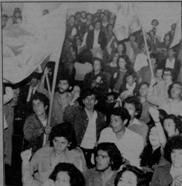
En un mitin durante la época en que fue dirigente juvenil

(*Nombre que tuvo la Juventud Vanguardista Costarricense anteriormente.