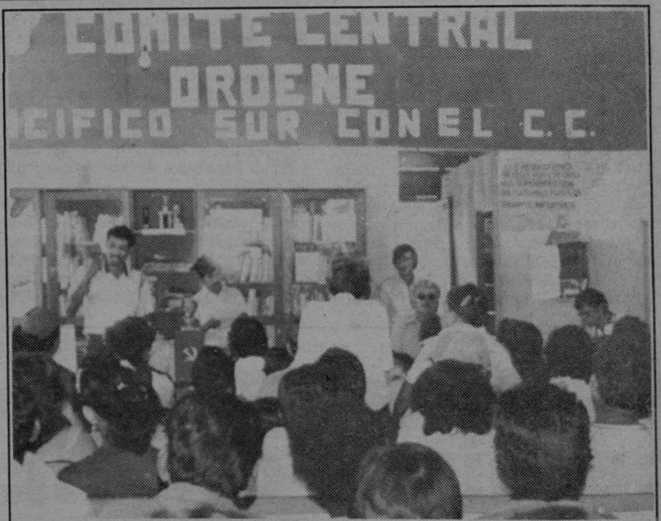
Durante una asamblea partidaria (1983)

Pasó al Partido y llegó a ser el dirigente del regional de Neily y desde esa