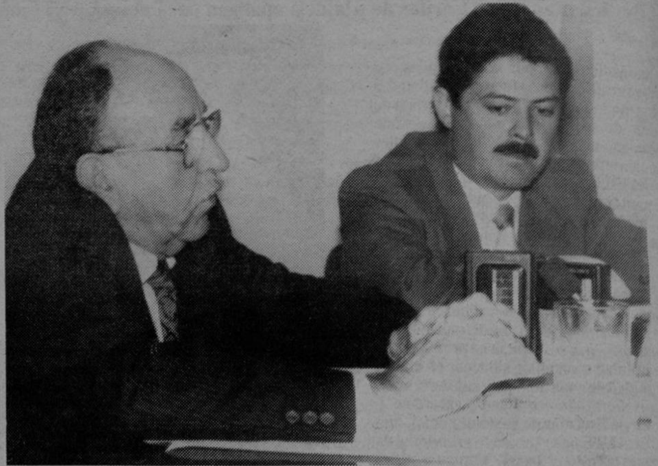
Victor Emilio Herrera, Ministro de Seguridad Pública, negó a la Comisión Legislativa conocer del operativo de la UAI y Narcóticos. A su lado el Viceministro Eric Koberg.

Por su parte el viceministro Koberg dijo que se consideraba "normal" la participación de la UAI en ese tipo de operativos por cuanto "se suponía que los sospechosos eran muy peligrosos y, al parecer, tenían drogas en su poder. Además de que anteriormente, según documentación que entregamos al juez, nunca se le ha consultado al ministro en ejercicio sobre el operativo que se planea o el tipo de armas o cuerpo policial que lo realizará", dijo Koberg y agregó que no se dijo en ningún momento que hubieran familias.