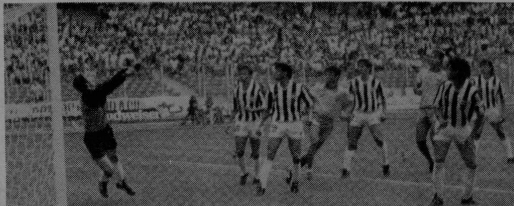
La Selección Nacional que abriendo una nueva era pasa a la historia del quehacer deportivo de nuestro país.

Faltan cuatro años para el próximo mundial, pero hay que empezar ya, ¿sabe alguien cómo, nosotros los simples aficionados, podemos intervenir en la total reestructuración de la dirigencia de nuestro fútbol?