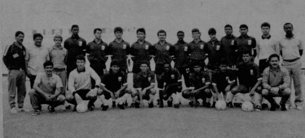
La Selección Nacional Sub 23, herederos inmediatos de la gloriosa primera presentación de Costa Rica en una Copa del Mundo.