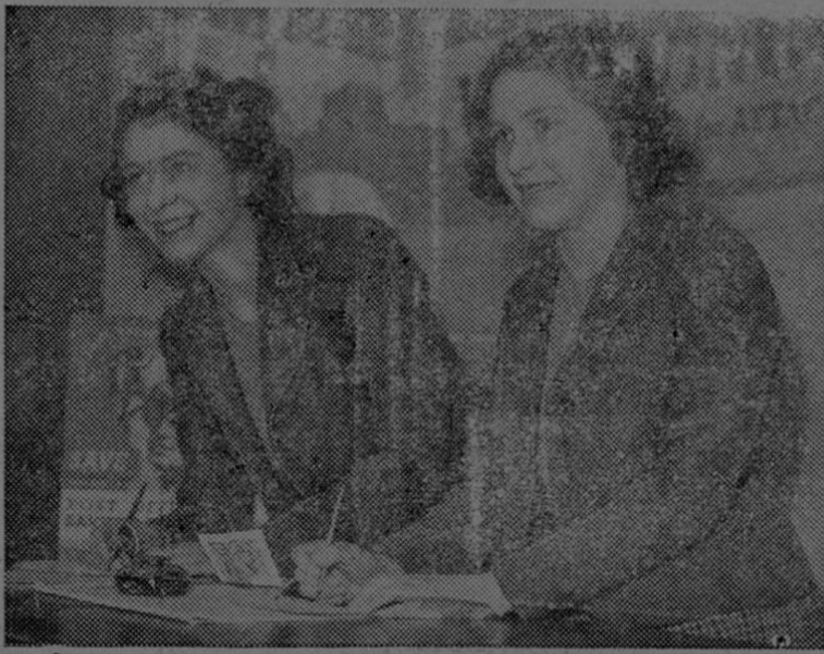
Las Princesas Elizabeth (a la derecha) y Margarita Rosa, de la familia real inglesa, firmando el primero de los dos certificados de guerra para nuevos reclutamientos.

Situada 150 varas al Norte del Hotel Costa Rica TELÉFONO 5319 — SAN JOSE — APARTADO 686