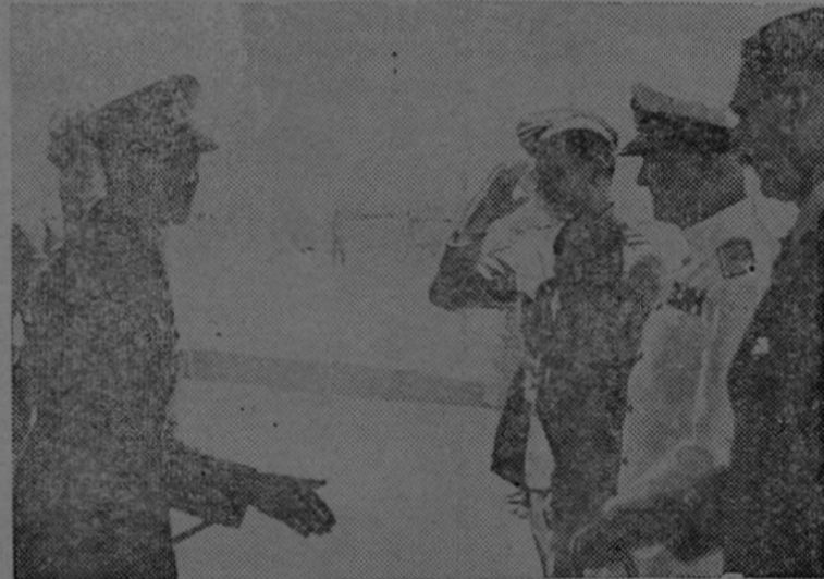
El Rey Jorge IV durante su visita al cuartel general del Octavo Ejército, reunido con el Alto Comando Aliado. De derecha a izquierda: General Eisenhower (detrás de su Majestad), el Mariscal del Aire, Tedder, el Almirante Cunningham y Mr. Harold Mac Millan.