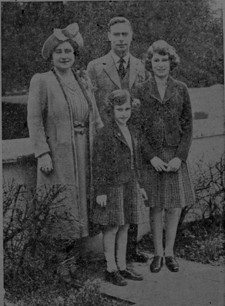
OBSEQUIO DE "DEFENSA NACIONAL" a sus estimados anunciados y lectores