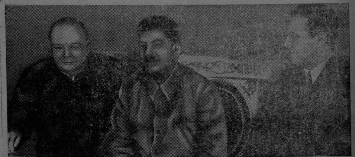
El Premier Churchill, El Mariscal Stalin y Averil Harriman, durante las recientes conferencias en el Kremlin. Esta es una histórica fotografía que con placer ofrece DEFENSA NACIONAL.

Lado atrás de la Plaza Central de Camiones