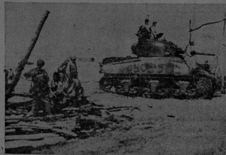
Tanques medianos norteamericanos saltan a tierra en la isla de Biak, en el Pacífico Sudoccidental.

Los Estados Unidos se apoderan de un Aeródromo a sólo 880 millas de Filipinas