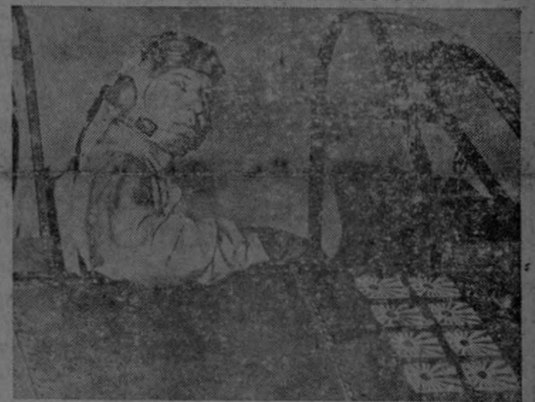
Después de solo tres semanas de combates aéreos, en los cuales derribó ocho aviones japoneses, Donald Lunyon, oficial aviador de la marina, entró a formar parte del selecto grupo de los ases de las fuerzas aéreas de los Estados Unidos. Las banderas japonesas pintadas en la carlinga del aparato de esforzado piloto, indican el número de victorias conquistadas.

Profesionales, médicos, farmacéuticos, hombres de ciencia y de negocios: