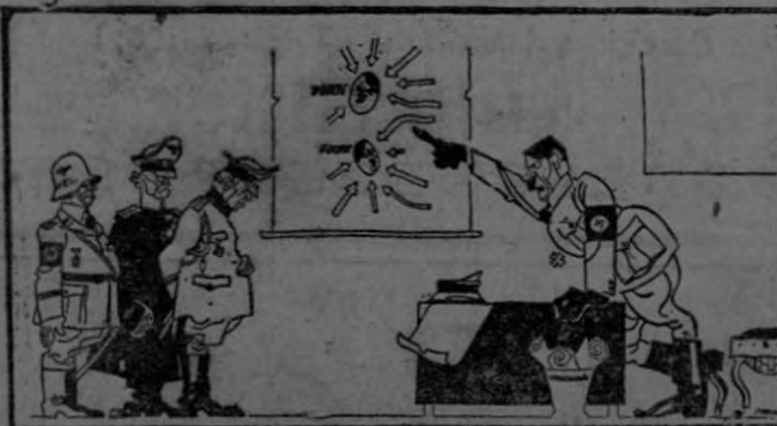
Sil «A pesar de lo que ha dicho Mr. Churchill sobre los ejércitos alemanes, yo mantengo que Uds. son unos idiotas.»

Atención propietarios de sus automóviles: