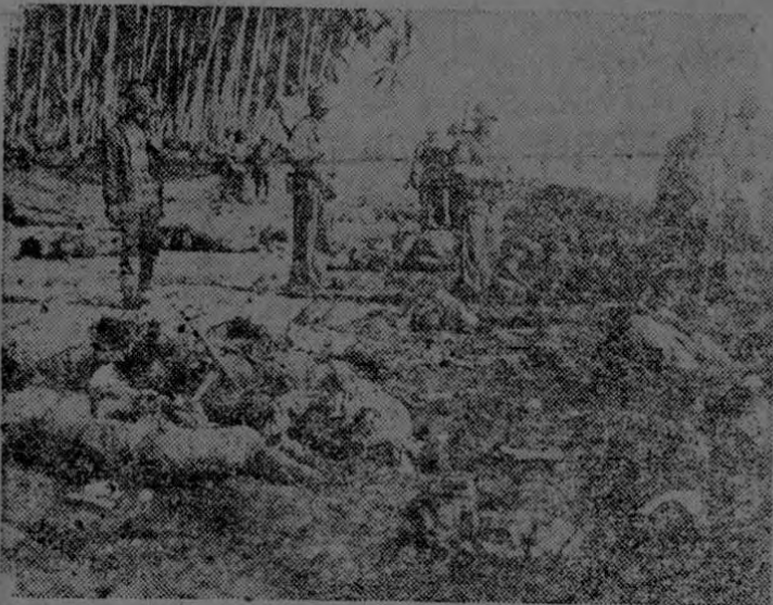
Los valientes soldados del cuerpo de infantería de marina de los Estados Unidos inspeccionan el campo de batalla, sembrado de cadáveres de soldados japoneses, después de un victorioso combate en la región del I.