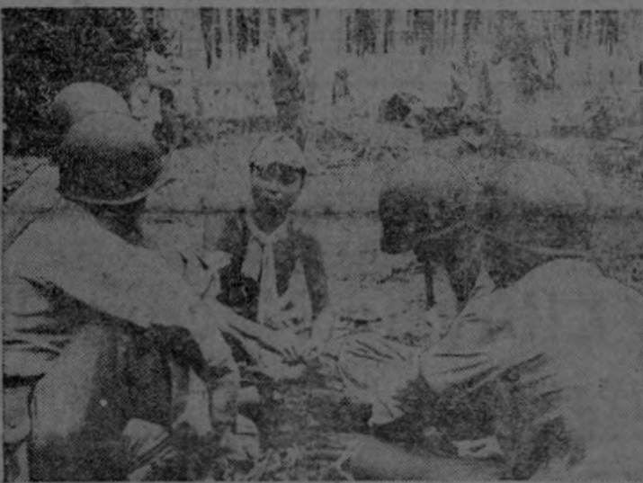
Oficiales del ejército de los Estados Unidos interrogando a un soldado japonés hecho prisionero en un combate en la región del Pacífico. Este, como todos los enemigos que caen en manos de las tropas norteamericanas, es tratado humanitariamente y se deleita en fumar un exquisito cigarrillo que le ha sido ofrecido por los mismos que le han capturado.