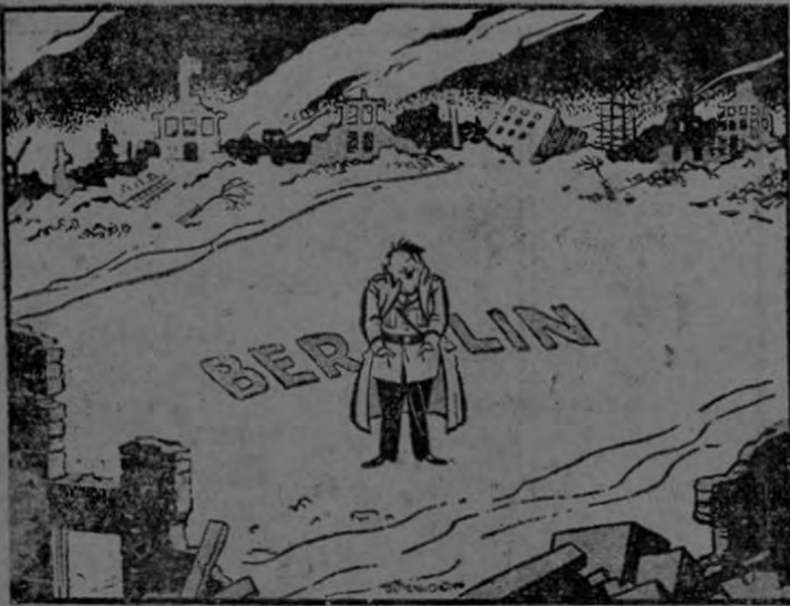
—Butterworth in the Manchester Daily Dispatch