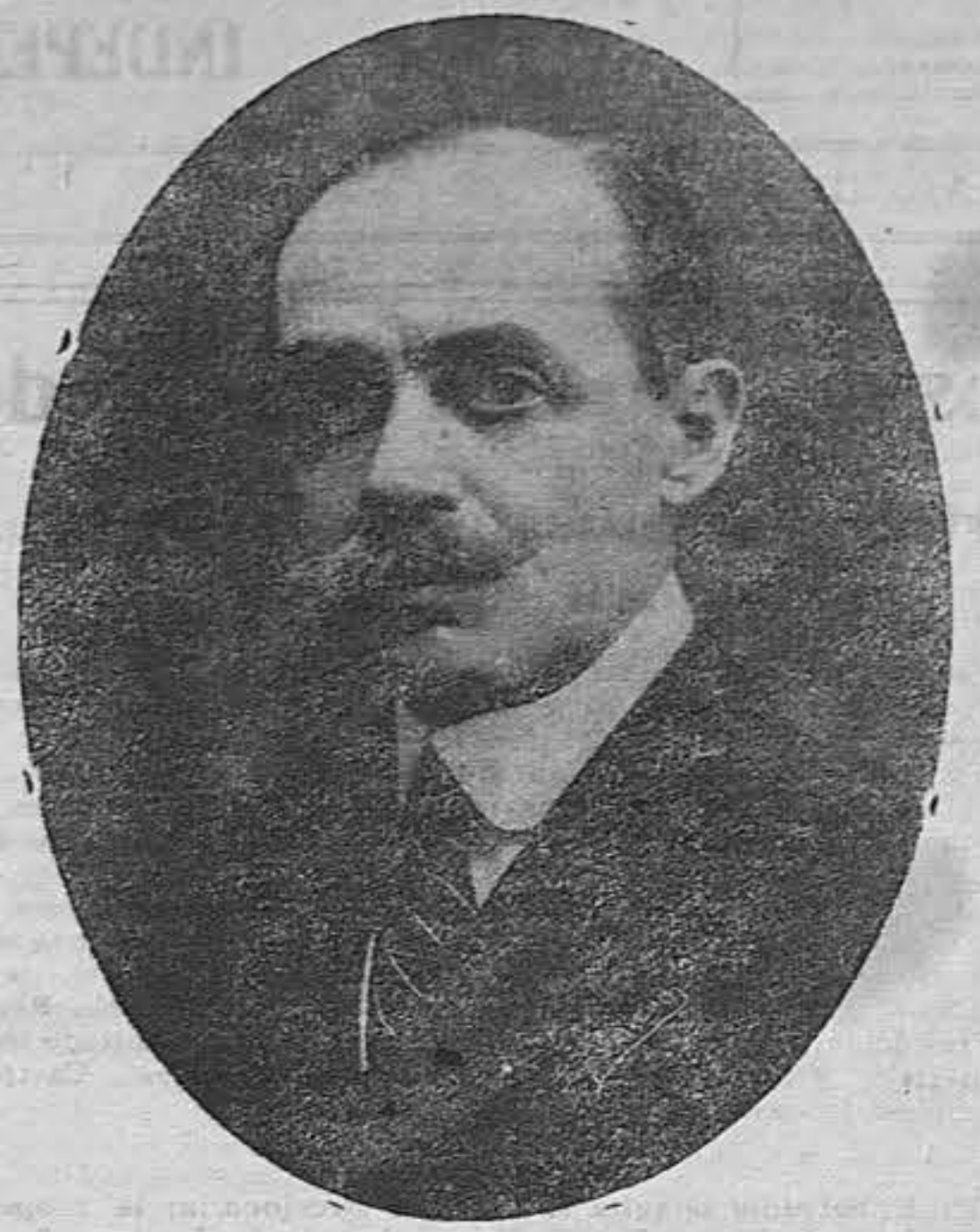
Excmo. Sr. don Pedro Quartín y del Saz Caballero Ministro de España en Centro América

De cuya llegada al país dimos cuenta en nuestra edición de ayer