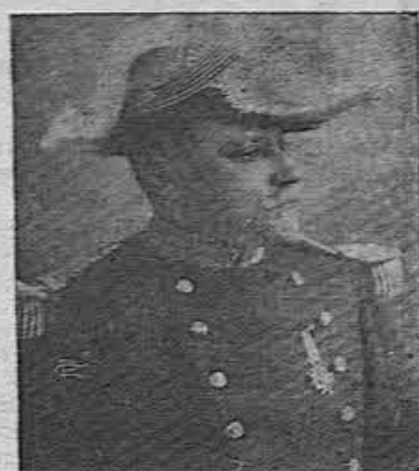
General de División don Miguel Larrave

Los pasajeros llegados de Honduras en el vapor «Acajutla» refieren que según noticias llegadas a aquel país uno de los hermanos Cuevas del Cid, Leopoldo, fué el que se sublevó contra el Gobierno del Gral. Orellana.