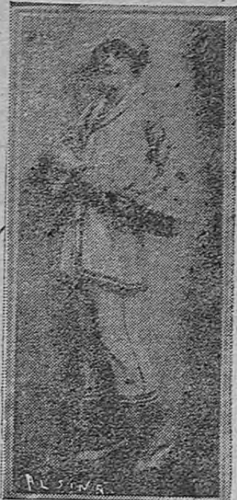
«PYJAMA» BLANCO DE PUNTO DE AGUJA, CON BORDADOS

Admirarás también el elegante calzado de estilo colonial llamado «Parfait». En realidad sus líneas son perfectas. Con este zapato la media de calado lateral resulta de muy buen gusto. Este elegante calzado también se ve en raso negro, piel mate y piel de suencia negra y gris. Las líneas del estilo colonial favorecen mucho y se nota la tendencia a este estilo hasta en el cal-