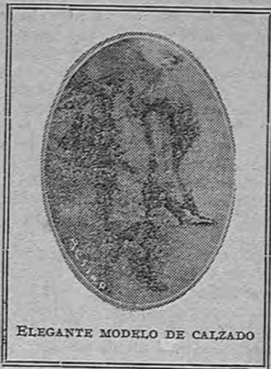
ELEGANTE MODELO DE CALZADO

Inevitablemente, la naturaleza protesta en nombre de la vida, que es algo más que risas de amor pueril. Vuestra creencia os lleva a pensar que el mundo piensa que ha llegado la hora del retiro y del renunciamiento; pero vuestra carne, vuestra sangre, vuestra inteligencia y vuestro corazón, siguen afirmando su voluntad y su necesidad de seguir viviendo, porque se sienten con fuerzas para ello, y vosotras, que seguís pensando que la flor de la seducción que podáis ejercer sobre el hombre es vuestra única vida, recurrís a subterfugios