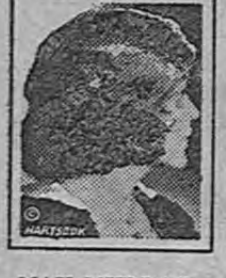
MAY MURRAY Famosa Estrella de Cine

Si quiere usted conservar su cabellera, tenga cuidado con el uso de los jabones. La mayoría de los jabones y champús preparados contienen demasiado álcali. Este destruye el cuero cabelludo, haciendo el cabello frágil y caído. Lo más prudente es adoptar como medio de limpieza el aceite de coco Mulsified, que es puro y absolutamente inofensivo, y que supera en eficacia a los jabones costosos o más cualquiera otra cosa que usted pueda usar.