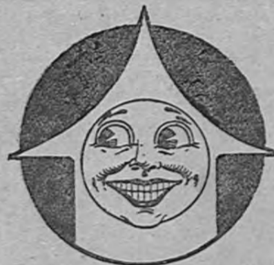
El Chiclero Wrigley

Los chicles de sabor más exquisito y sabor más duradero en el mundo.