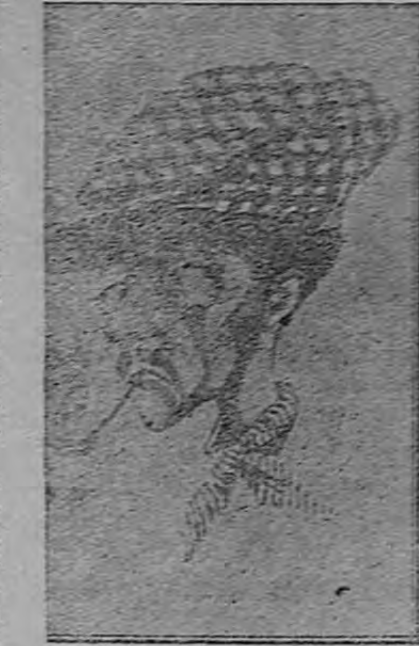
Caricatura de PACO SALAS Tenor cómico

El sábado próximo debutará en el Teatro América la notable compañía de operetas Marina Ughetti