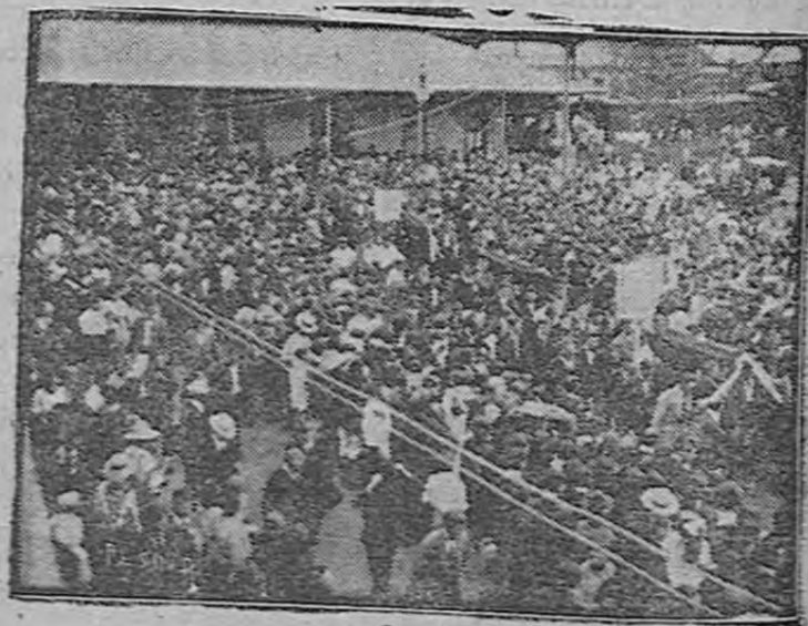
La procesión fúnebre al emprender la marcha de la estación a la Catedral