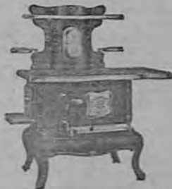
Se usa con leña y carbón de leña

Son una alimentación muy sabrosa LA MEJOR ESTUFA PARA ASAR TORTILLAS ES LA