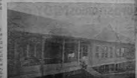
Carretera al Sanatorio

Otras de las grandes necesidades que tiene el Sanatorio, es la de poder estar crido a Cartago por una buena carretera. El camino actual es demasiado malo, sobre todo en la estación lluviosa y se tienen grandes dificultades para poder acarrear las víveres y los materiales necesarios para las reparaciones y mejoras, además de lo penoso que resulta para los enfermos y sus familiares que vienen a visitarlos. Una buena carretera, al Sanato-