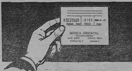
La toda conservación, el dinero cambia de hábitat, debiera existir una comisión, cuenta para la producción de muchos puros.

(Lo son para el comerciante, para el empleado y para el cliente.)