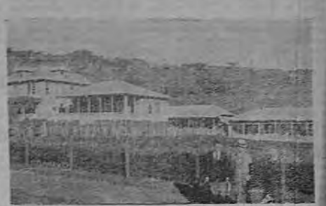
El Sanatorio visto de lado y como a 200 metros de distancia

Una de las mejoras más necesarias para esta Institución y que pueda mejorar sus servicios, es la de conseguir energía eléctrica suficiente para buen alumbrado, calefacción, aspiradores de polvo y para poder instalar en cuanto sea posible, una pl-