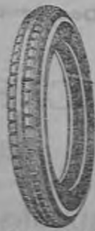
Las cámaras Royal son hechas de caucho de primera calidad, vulcanizadas al agua.

El empleo de caucho de la mejor clase, un empalme adecuado y una fabricación esmerada recomiendan las cámaras Royal a los automovilistas que exigen lo mejor.